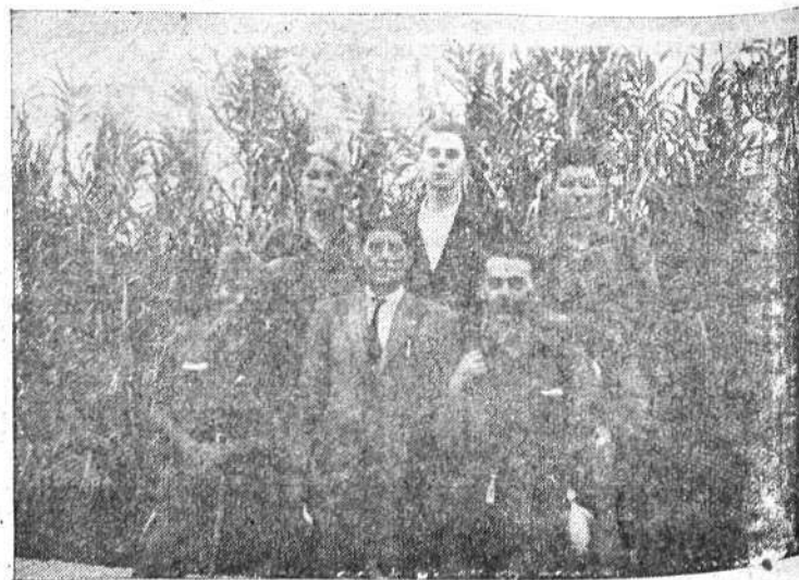
Los requetés de Burriana y Reinosa, que dan la vuelta a España, acompañados por el jefe del Requeté de Málaga y por un grupo de estudiantes de la A. E. T., que acudieron a despedirlos.