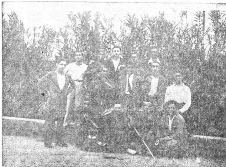
Grupo de tradicionalistas de Ulldecona que asistieron a los actos celebrados.

El día 12, a las siete de la mañana, se dirá en la parroquia de Ulldecona otra Misa con la misma intención.