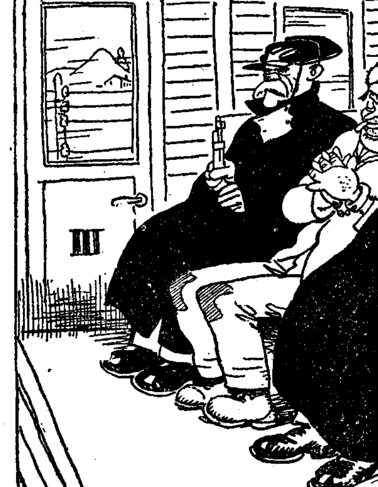
EL PRESO.—¡La verdad es que no hay nada que ilustre tanto como los viajes!