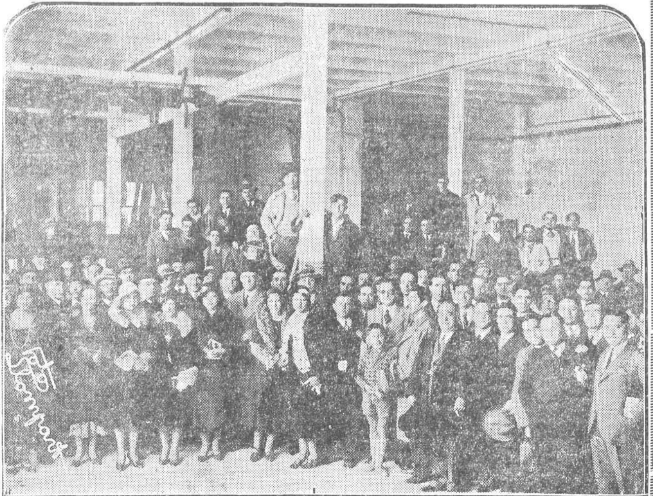
GRUPO DE EMPLEADOS Y AMIGOS QUE ASISTIERON A LA INAUGURACION