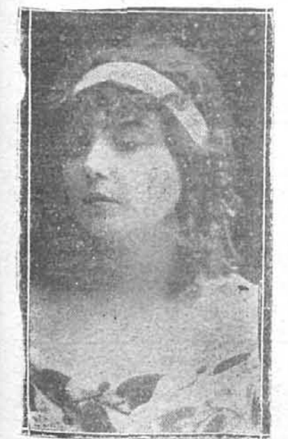
La notable contralto Conchita Supervia, artista española de extraordinarios méritos, que esta noche se presentará ante el público de la Zarzuela en El Barbero de Sevilla

Los señores jefes y oficiales de plantilla no pertenecientes a Cuerpo y los pensionistas de las cruces