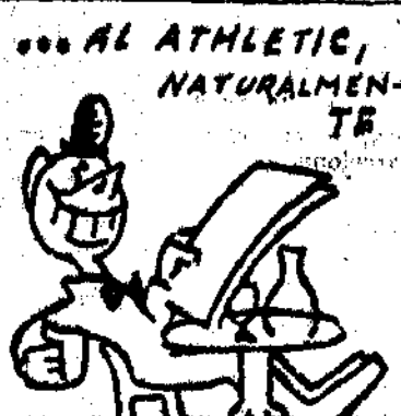
1.—¿Viene Anstol o no viene? Que venga es lo que conviene.