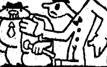
2.—Castigan, éste es el caso, a De la Puerta y Olaso.