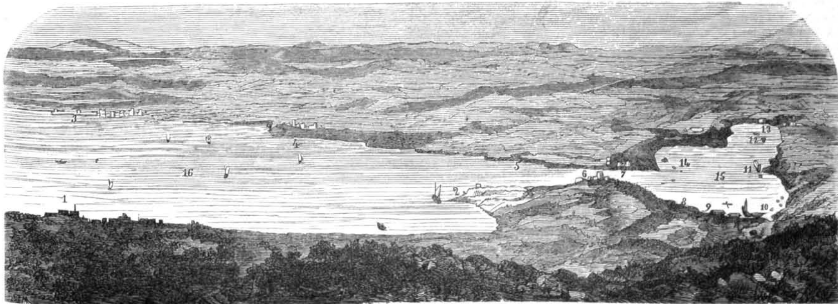
BAHÍAS DE VIGO Y DE SAN SIMON.

La festiva y ligera gaceta de los periódicos anunció hace tiempo que se habían emprendido algunas operaciones para extraer del fondo del mar los restos de los galeones que á principios del siglo pasado se sumergieron con la plata y el oro que traían de América. Cada cual comentó la noticia, salpicándola con algunos de esos ligeros chistes que siempre brotan de los labios españoles: