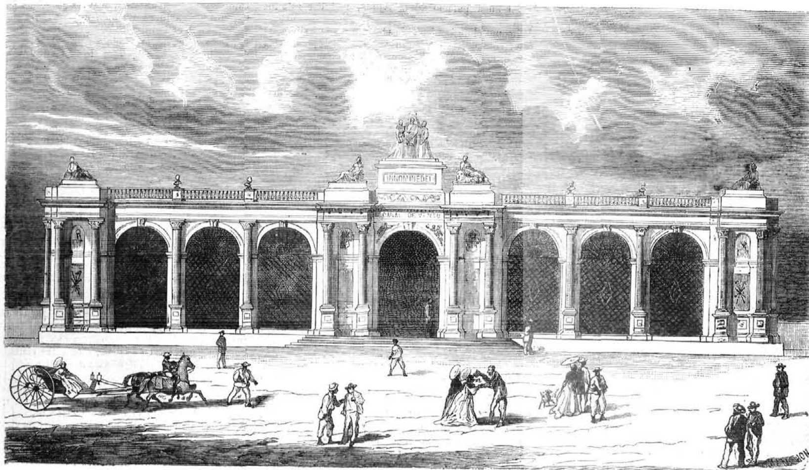
HABANA.—Exterior del depósito de aguas del canal de Vento.

guas de Toledo, en cuyo recinto, que tiene dos partes, figuran casi en su totalidad objetos debidos á las industrias del Estado, con más algunos otros que no tenían conveniente colocacion en los restantes puntos. La planta de este edificio es de doble T, ofreciendo, en consecuencia, tres salones para cada uno de sus dos pisos, que en realidad no forman más que dos espacios. En el salon central de la parte baja existen los minerales y las materias que de ellos se derivan, las artes químicas y lo referente á la explotacion de minas: en el salon de la derecha, la marina y el material de ingenieros civiles, con los modelos de obras públicas; y en el salon de la izquierda, el material de nuestros ingenieros de montes y el tabaco que explota la administración. El primer salon del piso alto, que corresponde al de la izquierda del bajo, está destinado al arte militar en la parte que concierne al cuerpo de artillería; y en su fondo hay un trofeo, formado por armaduras, cascos y efectos de guerra antiguos: el salon del centro comprende la parte exhibida por el Cuerpo de ingenieros militares, y la coleccion de objetos artísticos y arqueológicos que el Gobierno y muchos particulares han remitido en cumplimiento del programa que convocó á Viena esta curiosa materia de exposicion; finalmente, la sala del fondo, que ocupa