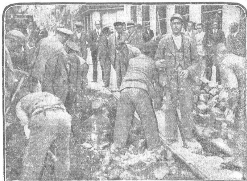
Los obreros trabajando en la reparación del trozo de la calle de Preciados, cercano a la Puerta del Sol, donde ocurrió un importante hundimiento en las primeras horas de la mañana del domingo.

El Gobierno de la India ha hecho establecer ayer un cordón militar alrededor de la ciudad de Quetta, que ha debido ser evacuada por todos