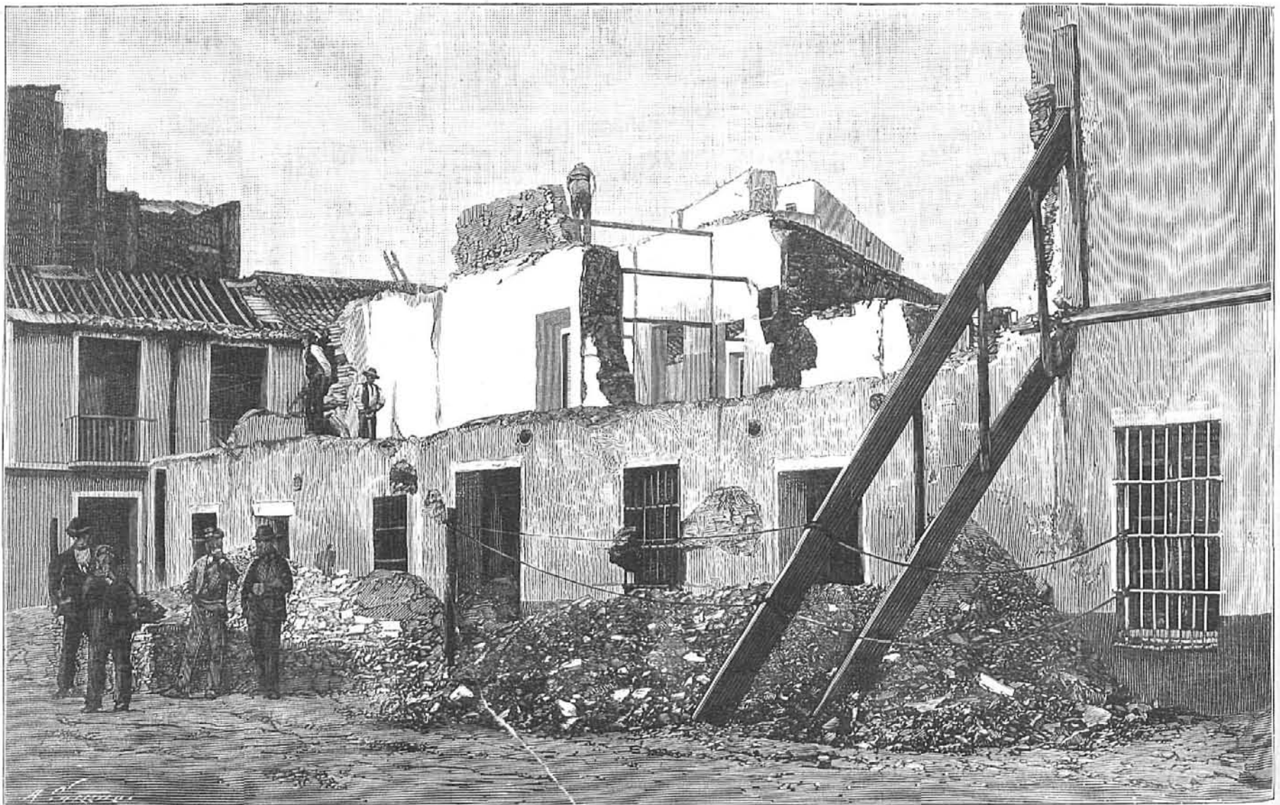
PLAZA DE LA VICTORIA: ASPECTO DE LA ENTRADA Á LA CALLE DEL CRISTO DE LA EPIDEMIA.