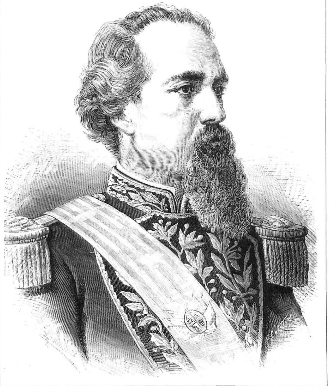
EL GENERAL MÁXIMO SANTOS, PRESIDENTE CONSTITUCIONAL DE LA REPÚBLICA DEL URUGUAY.

L A noticia del asesinato del general Gordon en los momentos en que dos traidores entregaban la plaza de Kartum al Madhi, ha producido en toda Europa una emocion profunda, y en Inglaterra consternacion pública y verdadero duelo nacional. La pérdida del hombre ha parecido más grande que la de la ciudad que defendía. La Gran Bretaña siente á la vez humillacion y remordimiento por no haber podido impedir el sacrificio de un hombre ilustre, que esperaba su salvacion confiando en el poder y la eficacia de su patria. Algunos periódicos ingleses se han publicado con orla de luto en memoria de la victima, y en toda Inglaterra se han hecho signos ostensibles de duelo y de tristeza, que no han sido mayores, porque la esperanza permite todavía á muchos ingleses aguardar la confirmacion oficial de la noticia. La muerte del general Gordon habrá sido cruel, si es cierto que cayó acribillado á puñaladas; pero ha sido una muerte gloriosa y envidiable, si el morir puede ser envidiado alguna vez. El general Gordon es una figura histórica importante, que ha dado su vida por su patria, y al caer cumpliendo su deber, es y será llorado por todos sus conciudadanos; ha ennoblecido su raza é inmortalizado su nombre, sucumbiendo al realizar una verdadera hazaña, digna de los tiempos heroicos é impropia de esta edad calculadora y poco novelesca. Los mismos que simpatizan por la causa del Sudan no podrán menos de honrar la memoria de un hombre grande, cuyo cuerpo, destrozado, será, si