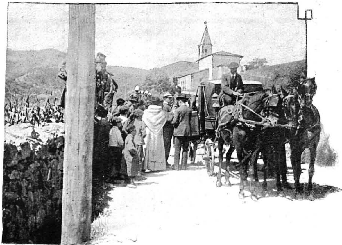
LA FÚNEBRE COMITIVA ANTE LA ERMITA DE NUESTRA SEÑORA DE LA ESPERANZA.