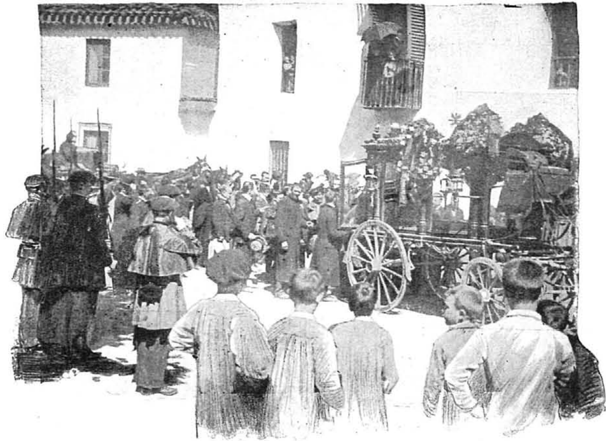
SALIDA DEL CADÁVER DEL BALNEARIO DE SANTA ÁGUEDA. — LOS MIQUELETES DEPOSITANDO EL FÉRETRO EN EL CARRO FÚNEBRE.