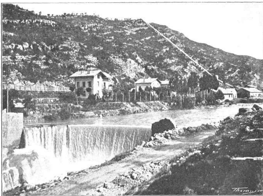
LA FÀBRICA DE CARBUROS Y LA PRESA D'AYGUES

Lo carril passa per la dreta. Los carros que's veuen son d'una brigada que s'ocupa en extreure del fons del riu los rails que una nit, durant la construcció de la línia, hi estimbà una gent desconeguda després de destruir un tros de via.