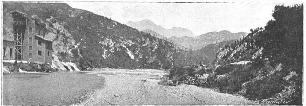
LO LLOBREGAT AB LA SERRA DE PICAMILL AL ÚLTIM TERME

Teníam ja una via ferrada que'ns facilitava l'accés a les regions altes de les valls del Ter y del Freser, lo que contribuía en gran manera a que fossen sovint recorregudes y admirades llurs belleses.