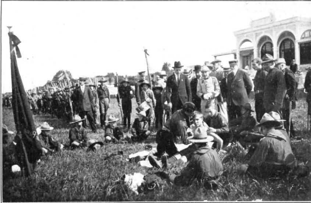
San Sebastián. - S. M. el rey D. Alfonso XIII presenciando la simulación de una cura hecha por los exploradores (boy-scouts) madrileños que, a su regreso de la excursión a Birmingham, se han detenido en San Sebastián.