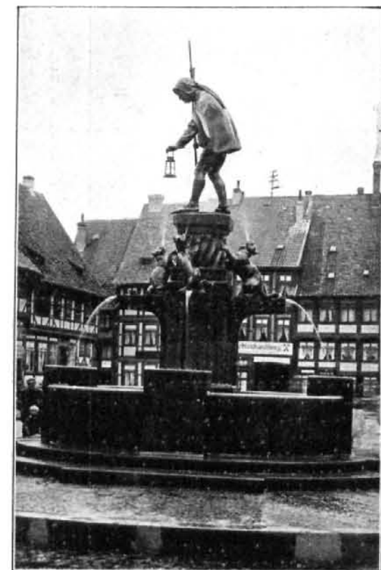
Fuente llamada de los gatos, obra del escultor Fernando Seebeck, recientemente inaugurada en Hildesheim (Alemania).

La Touche supo crearse una personalidad. Artista seductor y original, había llegado a ser verdadero maestro, después de haber llamado la atención por ciertas cualidades precoces y por una gran curiosidad de espíritu. Ya no era solamente un fantaseador amable, un divertido observador del drama y de la comedia, un transcriptor de las escenas de la vida y un improvisador de fiestas galantes, sino que había acabado por ceñirse a sus evocaciones de alegorías risueñas y voluptuosas. Pero al hacer esto, lejos de limitarse, había extendido sus dominios,