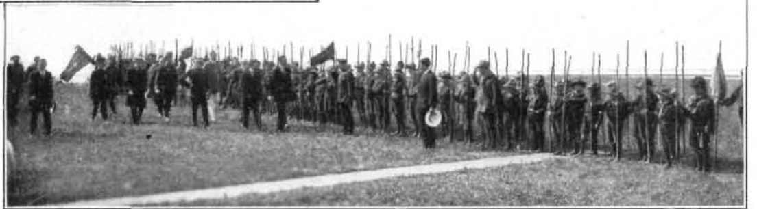
S. M. el rey D. Alfonso XIII revistando a los exploradores donostiarras en el monte Ulia