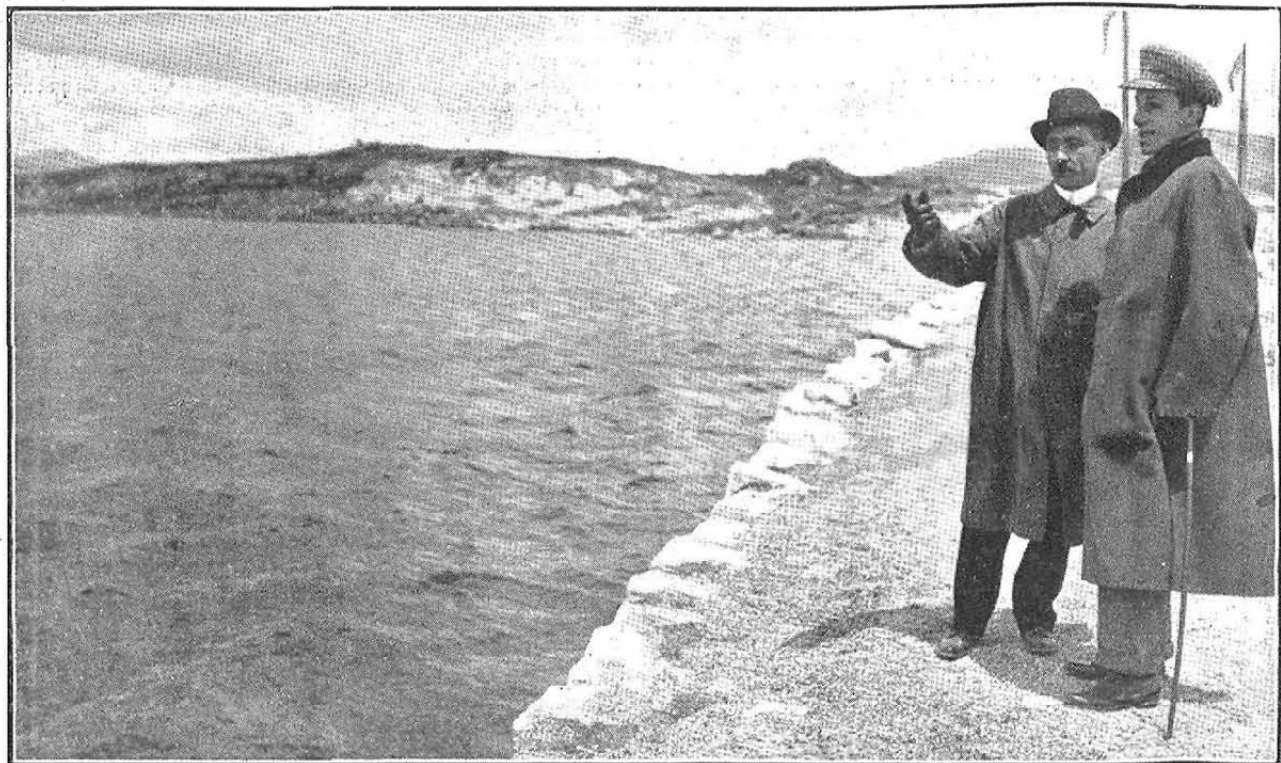
El marqués de Santillana explicando á Don Alfonso XIII, sobre el muro de contención del embalse, la importancia de las obras realizadas