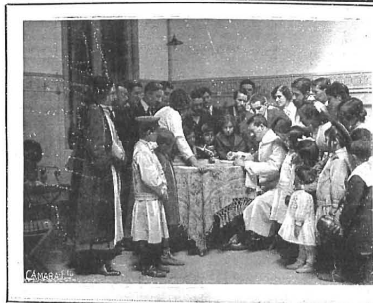
Un practicante anotando las solicitudes de vacunación