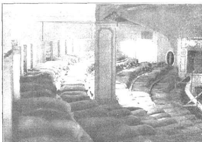
Voladizo del anfiteatro durante las pruebas de resistencia