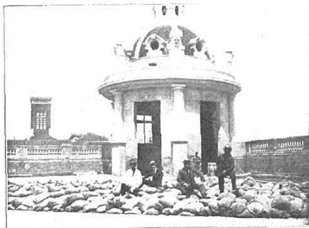
Detalle de la cúpula y terraza cargada durante las pruebas.

Las menciones honoríficas se concedieron al edificio construído en el paseo de San Vicente para la Pescadería Coruñesa, y cuyo autor es el arquitecto Sr. Iglesias, y a la casa del Sr. Conde de Artaza, construída en la avenida del Conde de Peñalver, esquina a la del Clavel, y cuya dirección estuvo a cargo del arquitecto D. Cesáreo Iradier.