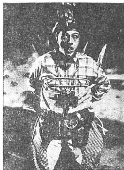
Helius preso por los lunáticos.