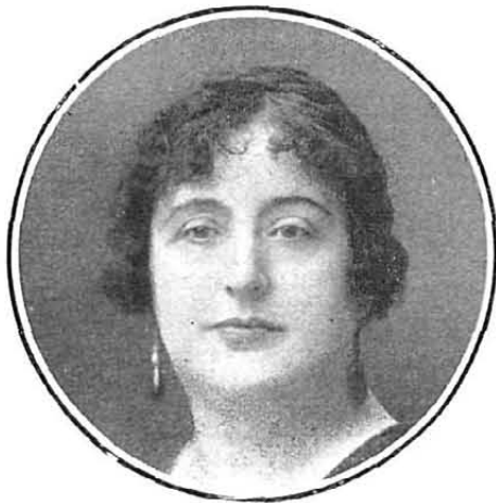
Carmen de Burgos (Colombine), ilustre escritora, que ha marchado a América del Sur en viaje de estudios