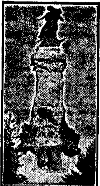
Monumento a los Sitios de Zaragoza