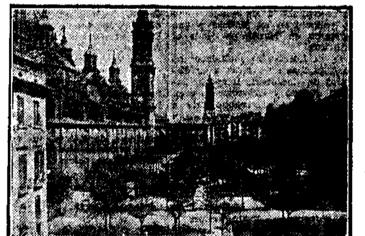
Plaza del Pilar