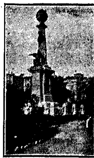
Monumento a Lanuza

Montado a la moderna, cuenta con una excelente instalación en la plaza de San Francisco, y en él se sirve un exquisito café, elaborado en máquina «Expres», y cuantos géneros selectos en refrescos, vinos y licores, fiambreros, mariscos, etc., se expenden en sus similares. El café Oriental es el más concurrido en Zaragoza, y su mejor reclamo lo constituye su numerosa y selecta clientela.