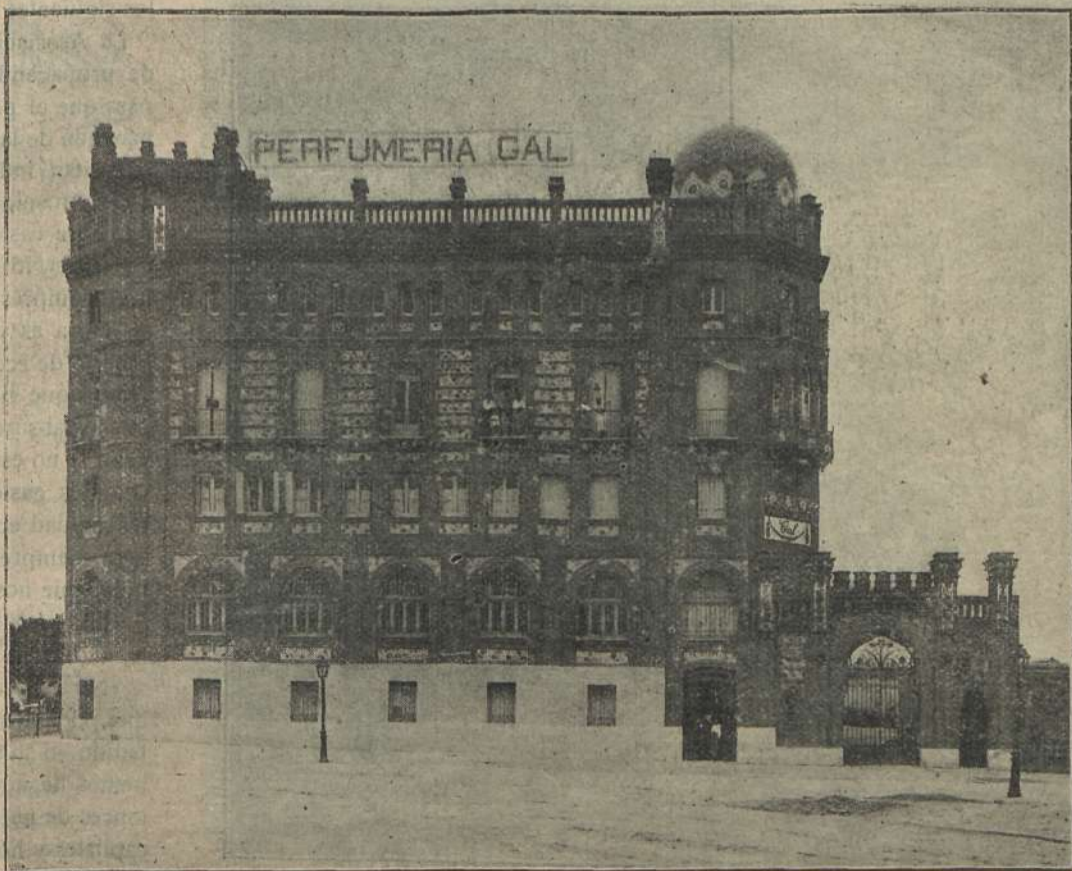
FACHADA PRINCIPAL DE LA FÁBRICA