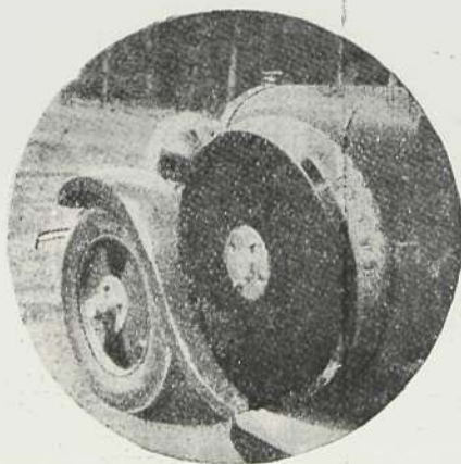
Varios momentos del Confort-Tablero acoplándolo a la rueda.

Un nuevo ejemplo demostrativo lo suministra la mesa plegable cuya foto-