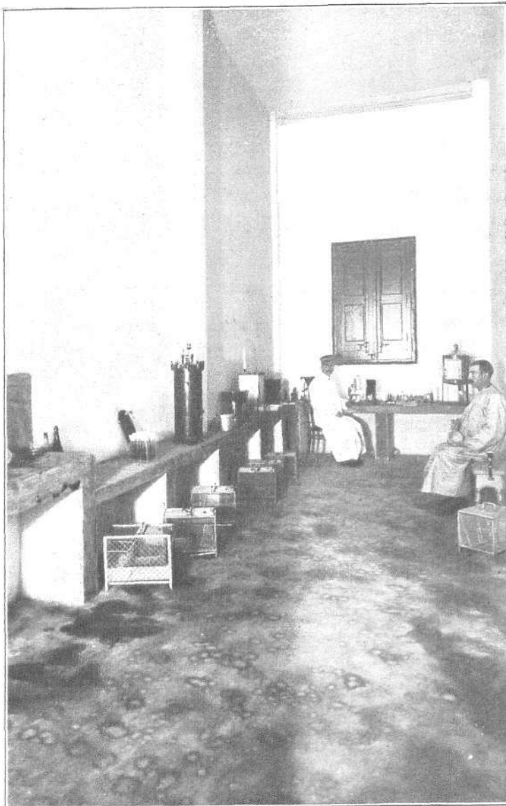
LABORATORIO MICROBIOLÓGICO.—SALÓN GENERAL