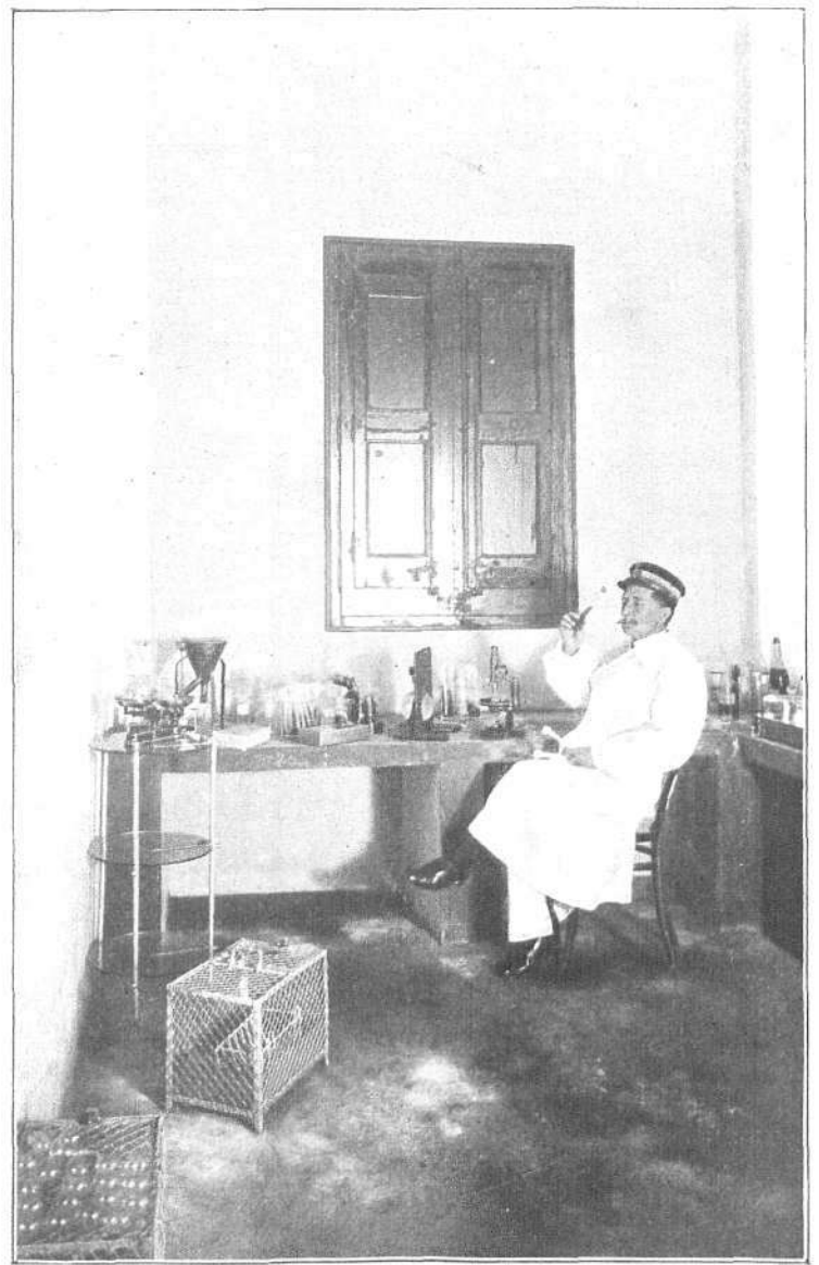
LABORATORIO MICROBIOLÓGICO.—SALA DE AISLAMIENTO