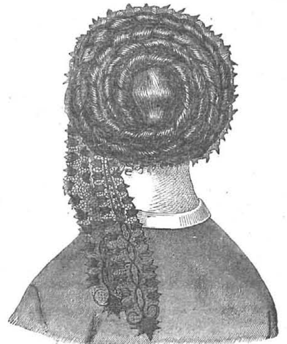
EL MISMO VISTO POR DETRAS.

Este estuche, de 10 centímetros de largo y 16 de an-