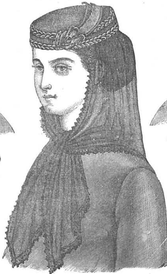
GORRA CON VELO.

Los cabellos de delante se dividen en dos partes, no á mucha altura, se ondean y se enrollan encima de la oreja, mientras que el mechón de las sinies se peina