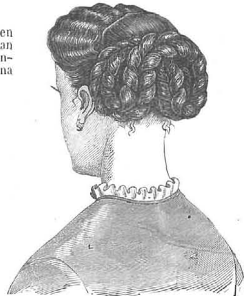
PEINADO SENCILLO (VISTO POR DETRAS.)

cabos, y dispuesta en espiral.—Una barba de encage negro completa el peinado.