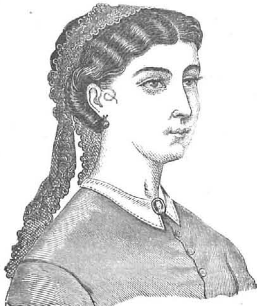
PEINADO PARA SEÑORA DE 40 A 50 AÑOS. FEBRERO DE 1868.

Los cabellos de delante se ondulan, se enrollan detrás de la oreja, y se sujetan debajo de la ligadura muy alta de los cabellos de detrás; estos van sostenidos por un crepé, luego se rodean con una trenza natural ó postiza, ligera, porque se la ha hecho sobre un crepé, de tres