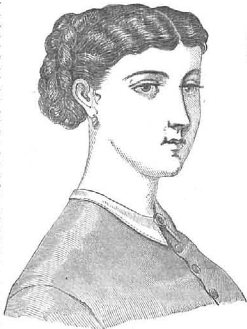
PEINADO SENCILLO (VISTO POR DELANTE)

Sumario.—Peinado sencillo.—Gorra con velo.—Peinado para señora de 40 á 45 años.—Estuche en forma de manguito para cepillo.—Bolsillo al crochet.—Tira de aplicación de paño, etc.—Tul bordado.—Velo de lámpara.—Entredós al crochet.—Encage al crochet.—Un centro de velo de butaca.—Tocador Duquesa. Portiers ó cortinas.—Sillon inglés.—Sillon de espaldas móvil.—Tres diversos trajes.—El gaitero.—Paquita.—Una segunda madre.—Napoleon.—Figurín iluminado.—Ajedrez.—Geroglífico.