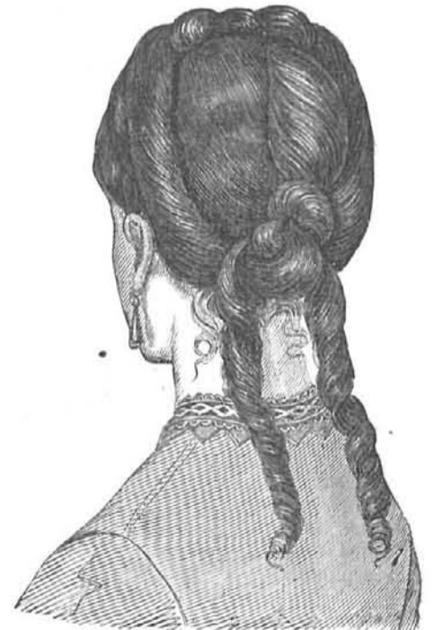
PEINADO MARIA-ANTONIETA (VISTO POR DETRAS).