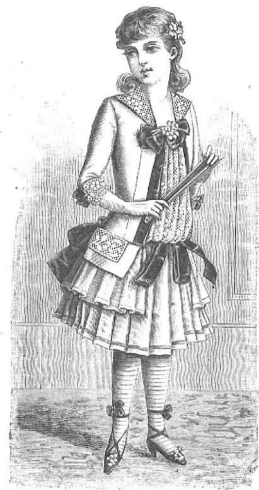
22.—Traje de reunión para niñas de 8 á 10 años. (Explic. y pat., núm. VI, figs. 45 á 54 de la Hoja-Suplemento.)