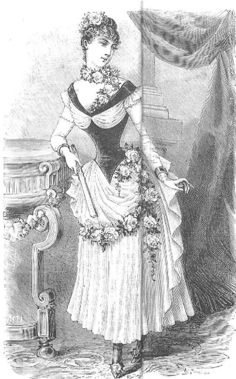
28.—Traje de baile para niñas.

Véanse las explicaciones en el recto de la Hoja-Suplemento al presente número.