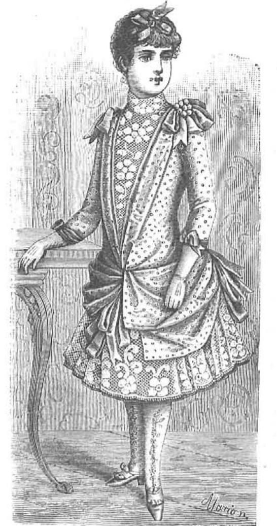
23.—Traje de reunión para niñas de 9 á 11 años. (Explicación en el verso de la Hoja-Suplemento.)