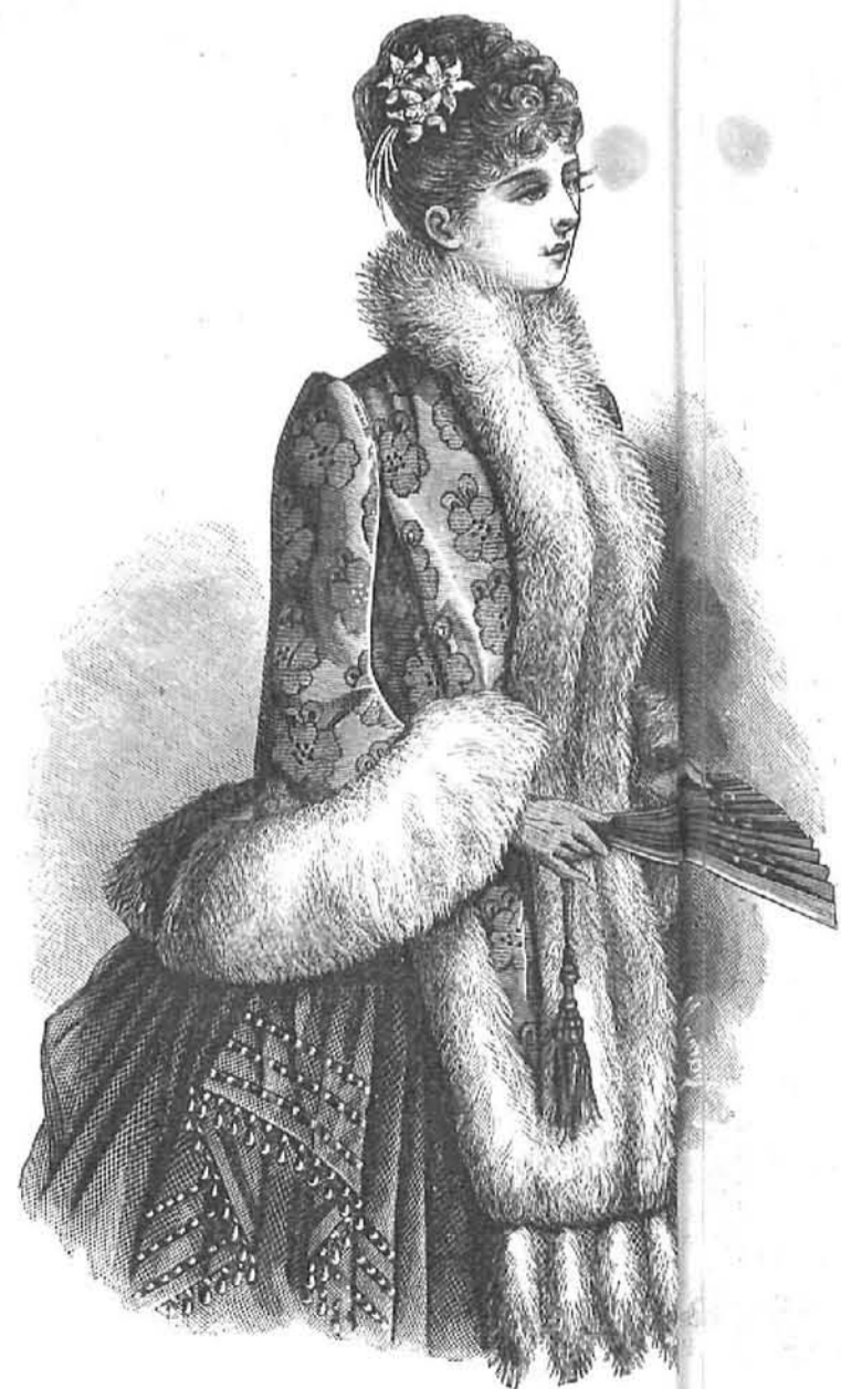
29.—Salida de baile ó teatro. Explicación en el recto de la Hoja-Suplemento.)