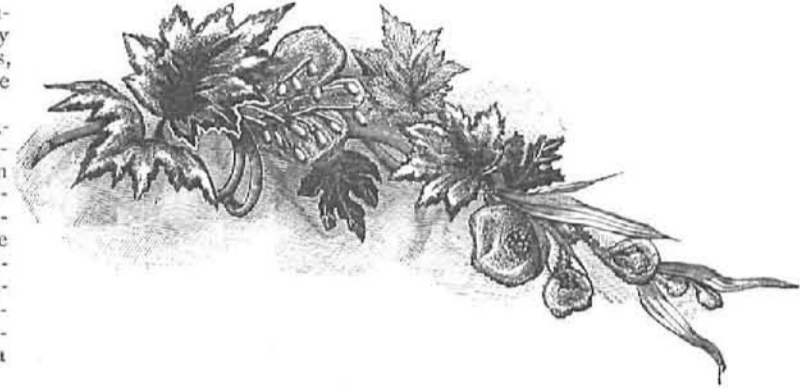
27.—Adorno de flores para vestidos de baile.