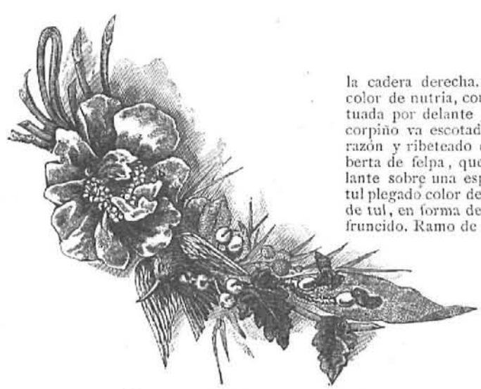
24.—Adorno de flores para vestidos de baile.