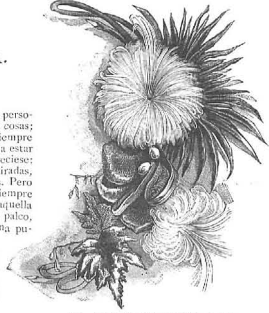
26.—Adorno de flores para vestidos de baile.

Se representaba un baile: Camila seguía con curiosidad las actitudes, los gestos y los pasos de los actores; comprendía que aquello era una pantomima, y ella desataba entondería