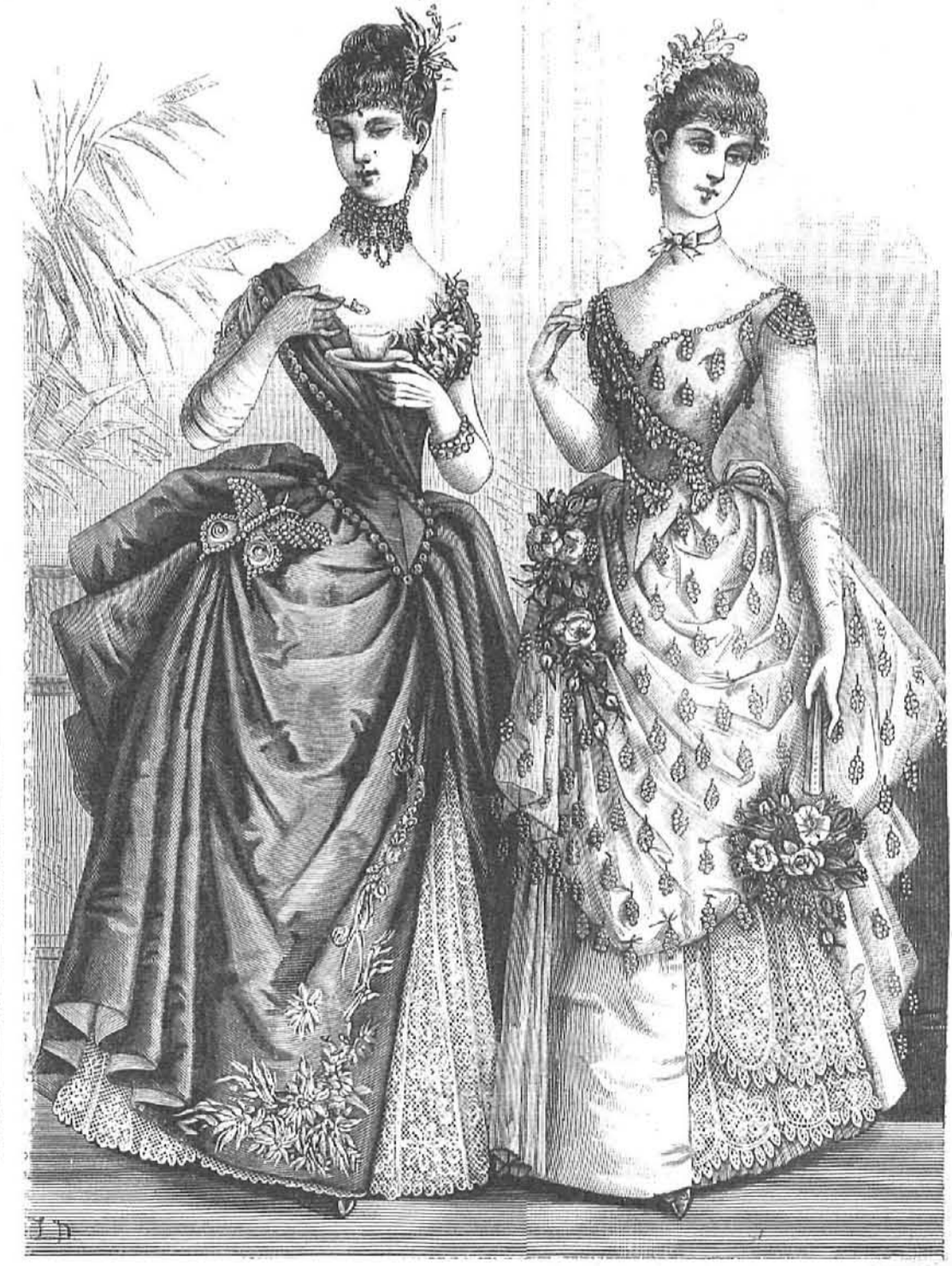
33.—Vestido de faya para baile y soirée. (Explicación en el recto de la Hoja-Suplemento.)