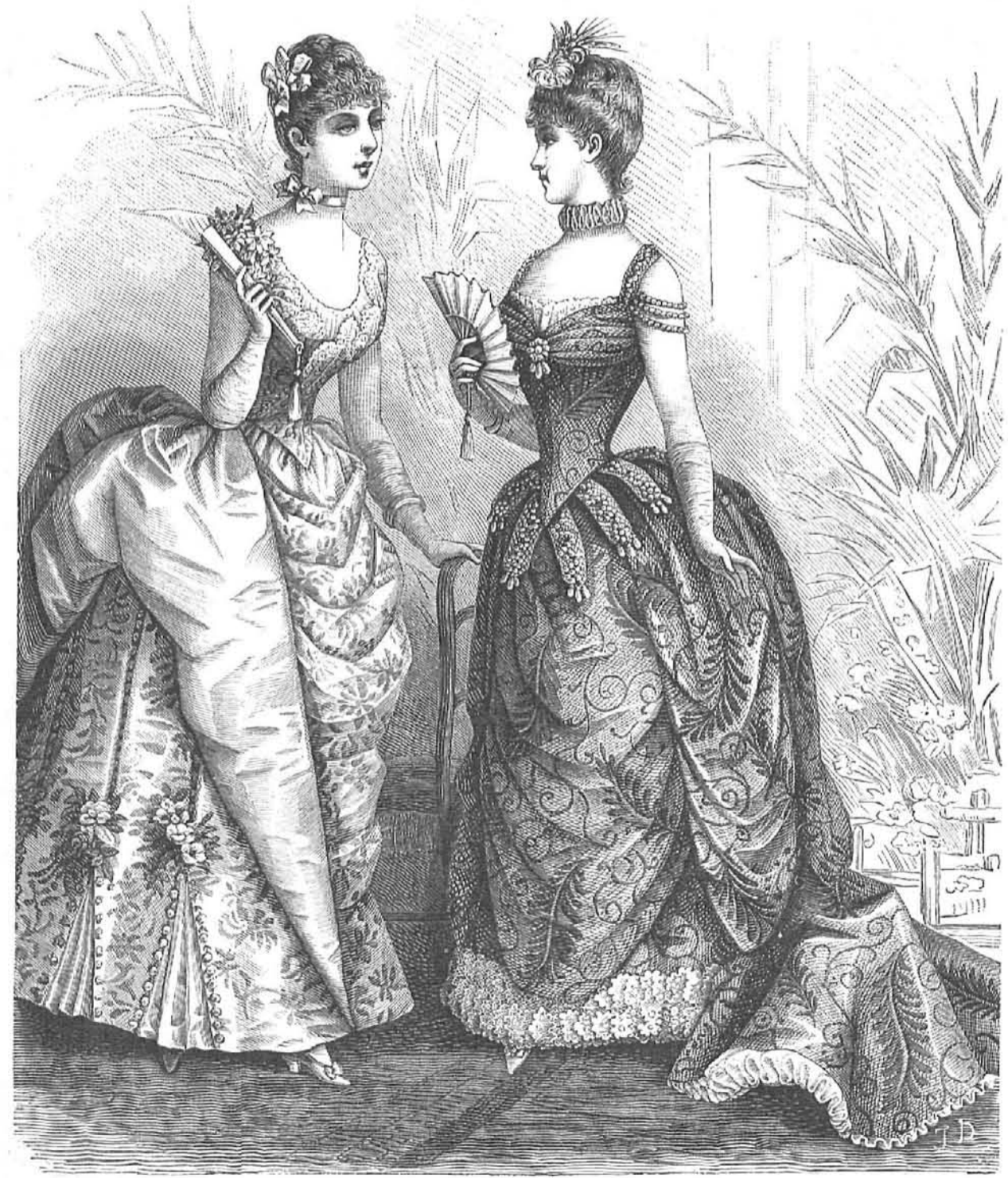
31.—Vestido de raso y gasa de seda para baile. (Explicación en el recto de la Hoja-Suplemento.)