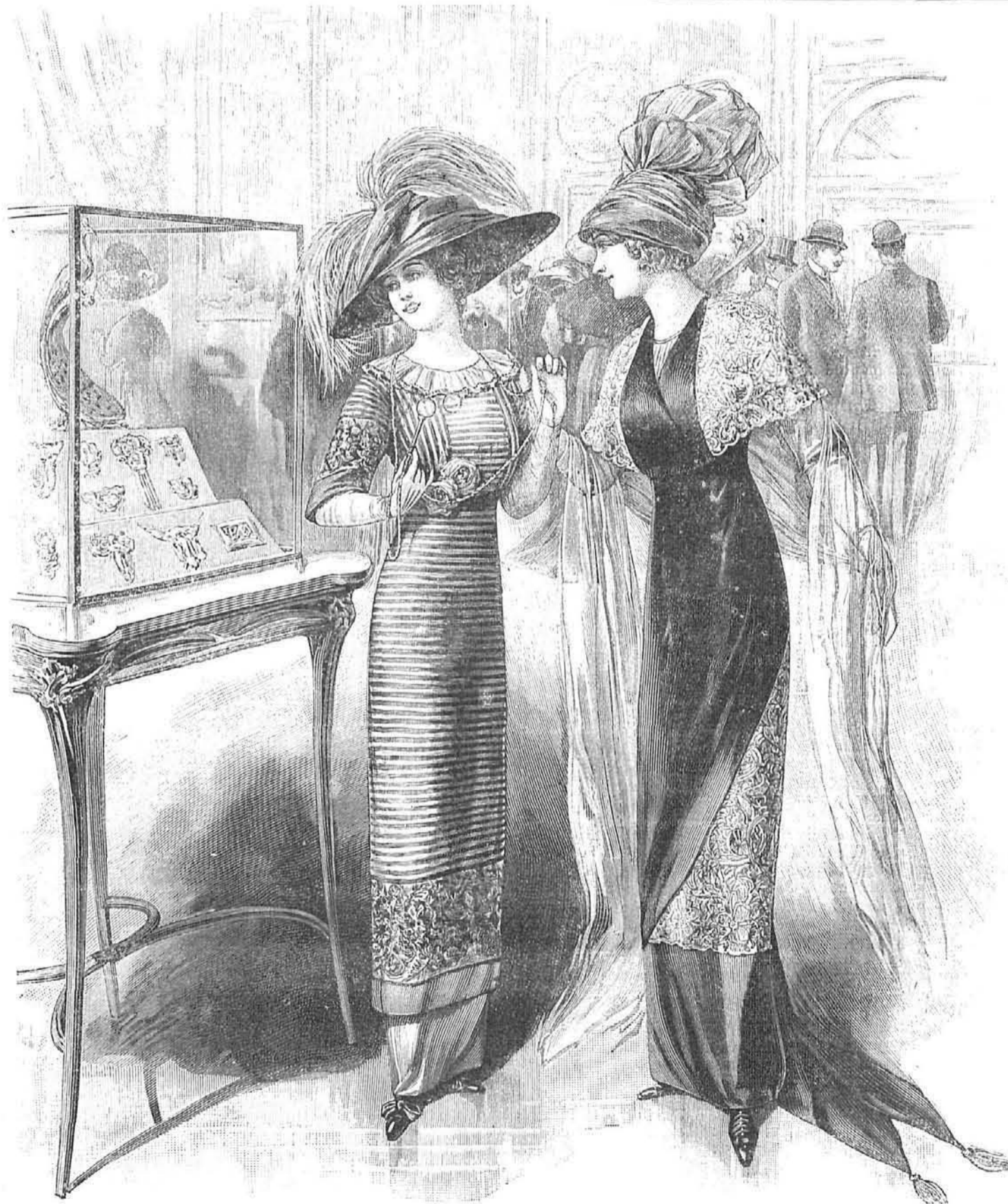
1 y 2.—Toilettes para Exposiciones.