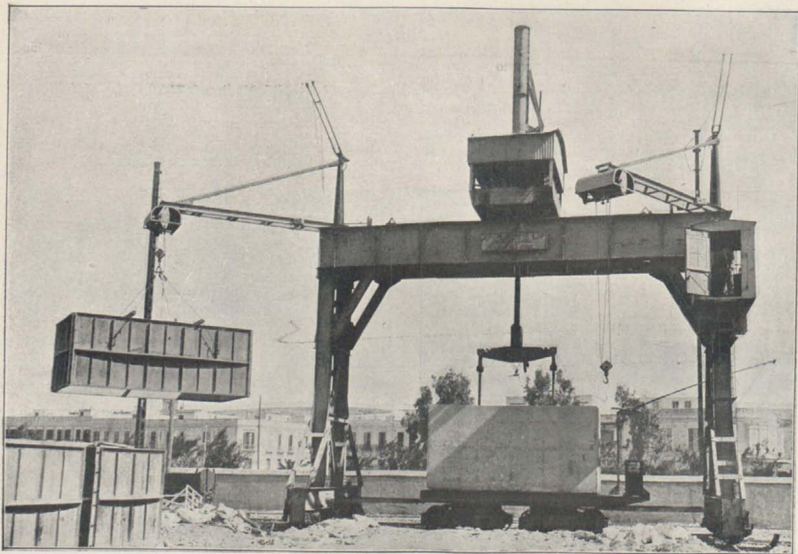
GRUA «GOLIAT» Y CARRO TRANSPORTADOR

Entretanto, la brigada San Martín, después de una marcha brillante desde Ras Quiviana, llega á los pozos de Acgraz, en la llanura de Bu-Arg, batiendo denodadamente al enemigo