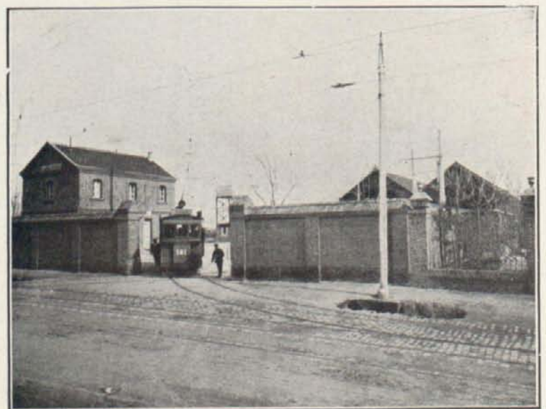
ESTACIÓN DE LEGANÉS.

En todos los trayectos y antes de las ocho de la mañana, el precio del billete es de 0,05.