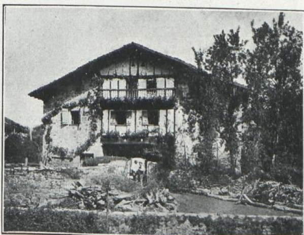
Otras dos fotografías de la misma colección.