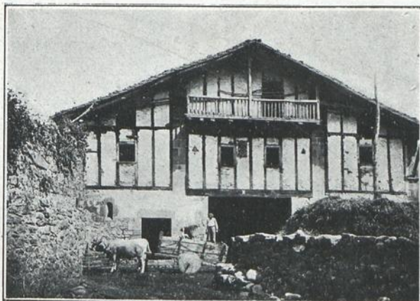
Dos fotografías de la colección «Caseros Vascos» que obtuvo el primer premio en el certámen fotográfico de Pamplona