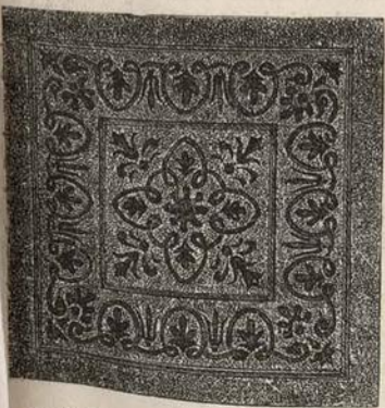
2. Almohadon bordado de aplicacion.