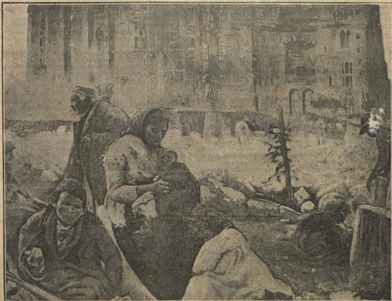
CONTRASTES HUMANOS. —ALLÁ RESPLANDORES DE FAUSTO; ACÁ SOMBRAS DE POBREZA. LOS JASPES DE LA OBRA MAGNÍFICA, SIRVIENDO DE ESTUCHE A LOS ANDRAJOS. LA NOTA ES SOBRIA É INSPIRADA.—CUADRO DE J. MIR, CON LAURO EN PARÍS, MADRID Y BARCELONA. HOY PROPIEDAD DE LOS SRES. JUÑER, Á QUIENES AGRADECEMOS EL PODER REPRODUCIRLO.