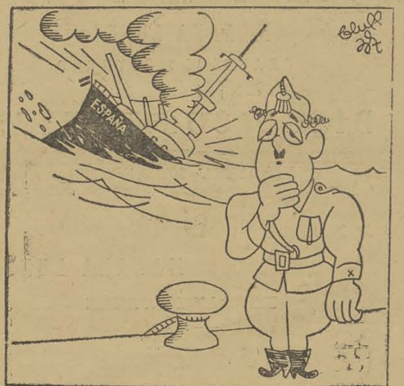
«Ni barcos ni honras»