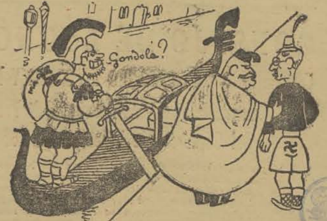
-Suba usted, príncipe Schuchnigg, suba.