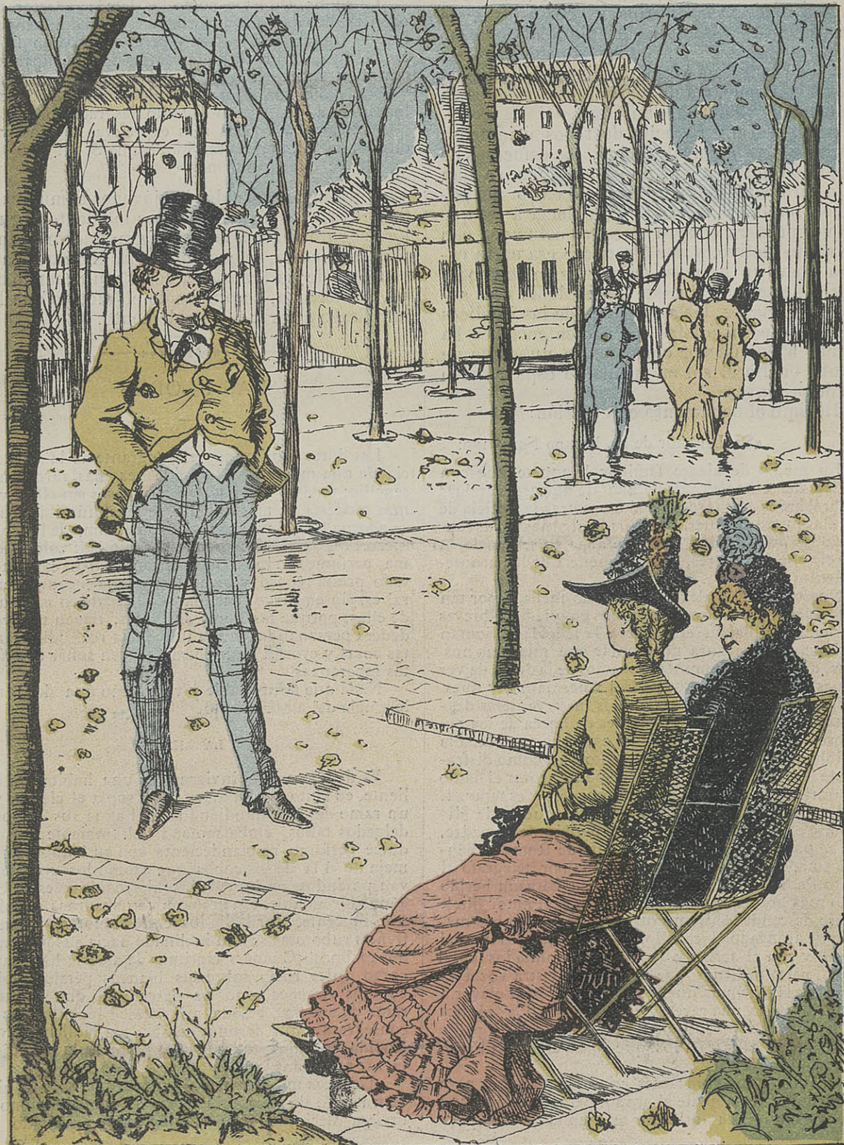
—Ahi tienes. ¿No querias conocer al autor de esas poesias que tanto te enamoran? Qué te parece. —Un libro muy bello, pero... mal encuadrado.

Suscripciones: Por 6 meses 2'50 pesetas. — Por un año 4. — A los corresponsales 2'50 la mano.