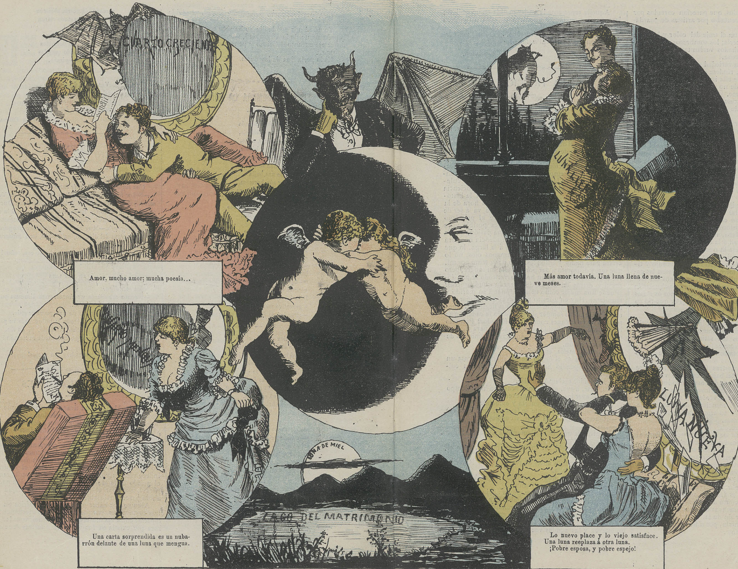
Amor, mucho amor; mucha poesía...