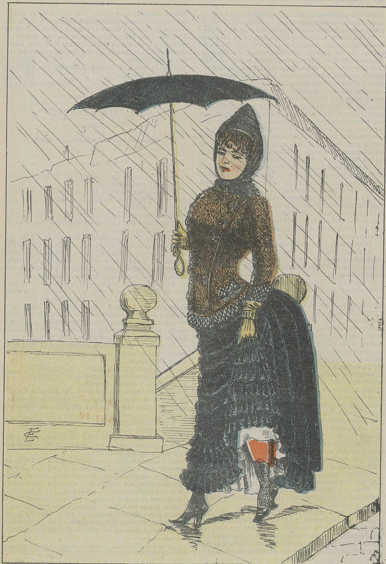
Exposición de los Países Bajos.