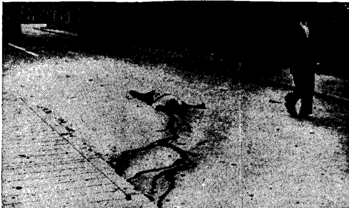
Algún periódico monárquico y fascista ha dicho que la fotografía publicada por nosotros el pasado sábado era una composición. Para que se convenzan que era verdadera, reproducimos hoy un detalle de la misma, un pajano muerto en las calles de Oviedo...