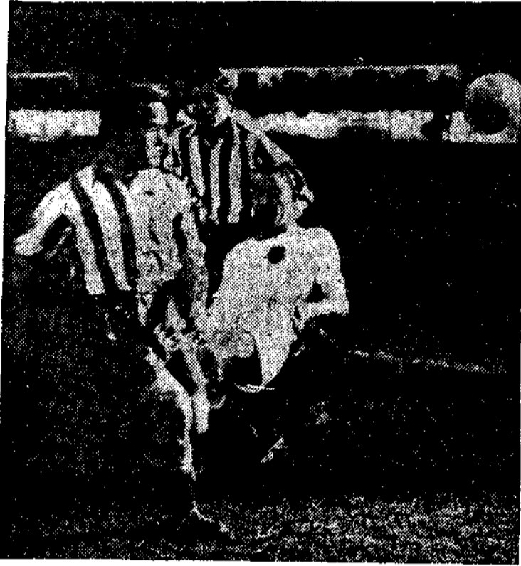
LOS PARTIDOS DEL DOMINGO.—Valencia-Athlético de Madrid

Ganaron todos los equipos que jugaron en su campo, menos el Athlético Club madrileño