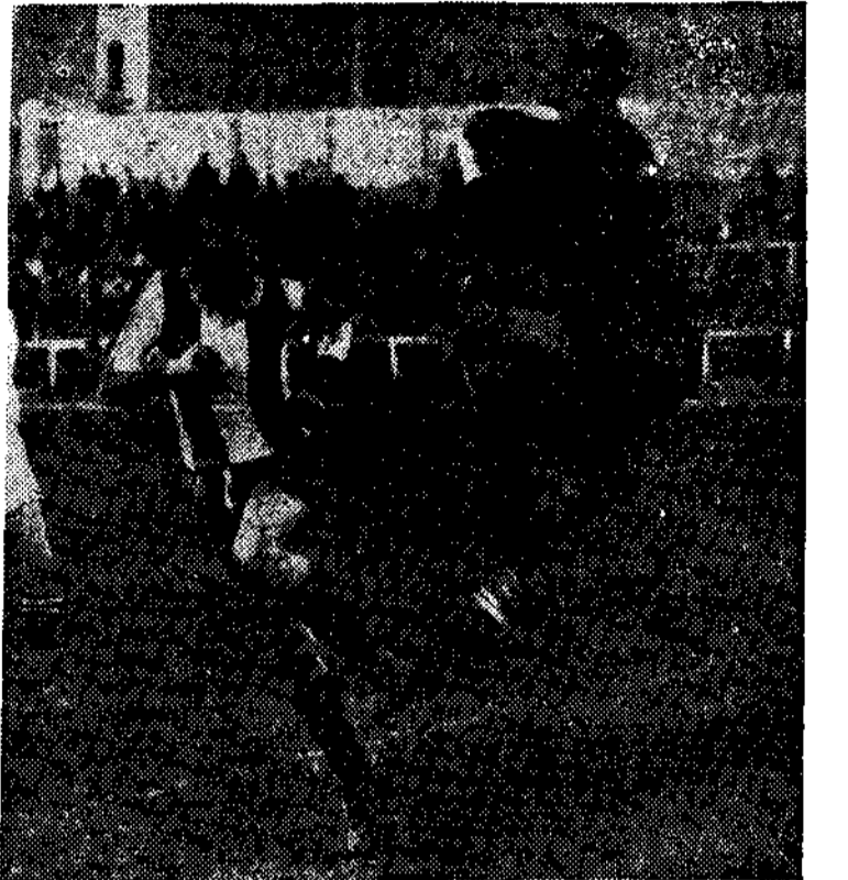
LOS PARTIDOS DEL DOMINGO.—Unión Sporting, de Vigo, y Nacional