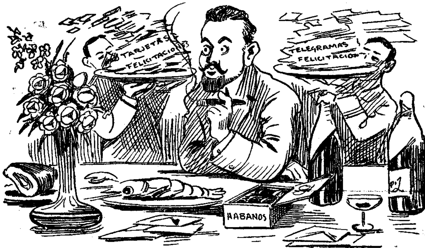
Macías, á raíz de las denuncias.