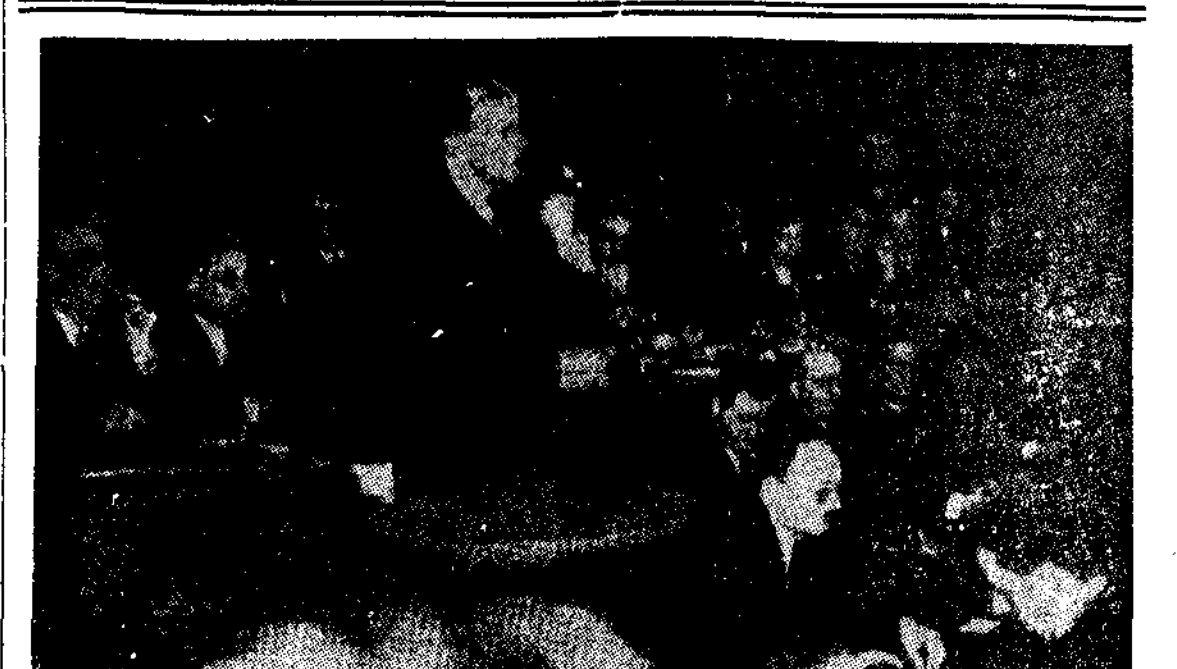
Monsieur Daladier, elegido presidente del partido radical francés en la última Asamblea, durante su discurso de gracia por la designación