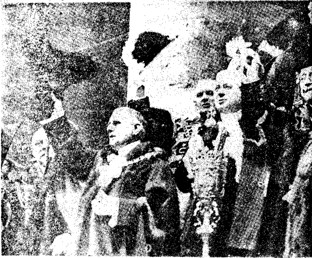
El alcaide de Londres y otras altas personalidades de la ciudad durante el acto de la proclamación del nuevo soberano Eduardo VIII

En representación de España asistirán a los funerales el ministro de Estado y el general Franco, acompañados de un jefe y dos oficiales