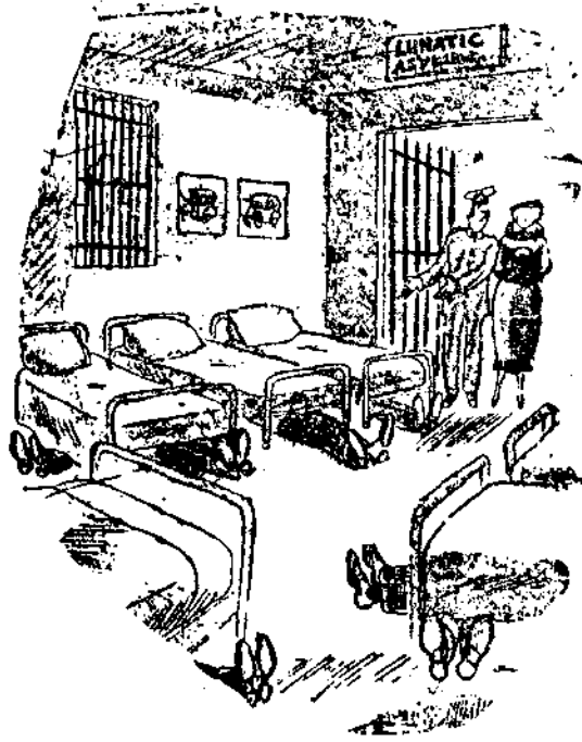
EN EL MANICOMIO —He aquí, señora, la sala de los automovilistas locos.