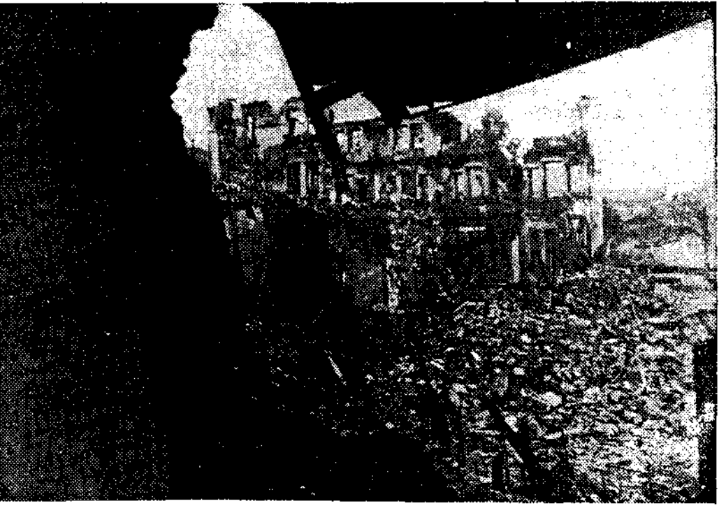
¿Quién voló el Instituto de Oviedo, donde los revolucionarios habían instalado un depósito de dinamita? ¿Los mineros? No. Los mineros, cuando el edificio ardía y la catástrofe era inevitable, fueron avisando a todos los vecinos de la calle Santa Susana para que evacuasen sus viviendas. ¿Una bomba caída de arriba? Es lo más probable. Y esta foto muestra el estado en que quedó el edificio

Y este es, concretamente, el caso de «Ya». Así habremos de repetir en el juicio de conciliación. Lo lamentamos por quienes nos demandan. Que necesitan tener tranquilidad para hacerlo, sabiendo positivamente que es verdad cuanto decimos. Y que no deja de serlo porque a «Ya» le hayan salido algunos imitadores.