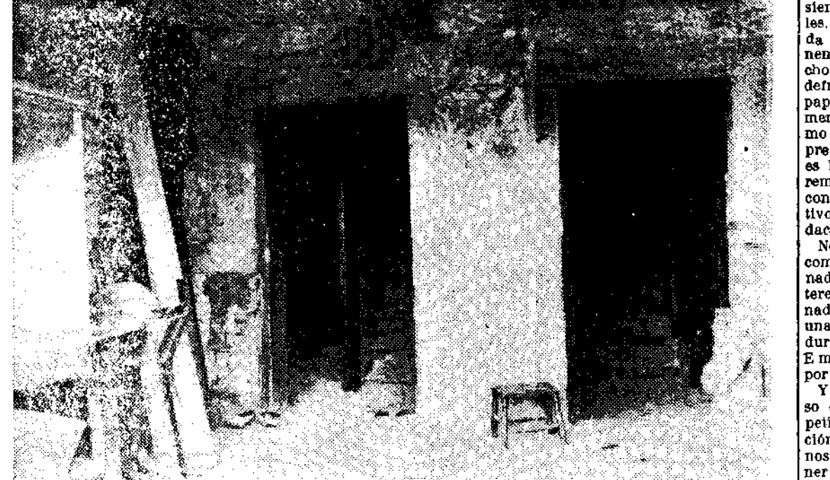
Esta es la casa número 2 del camino de Villafra. De esta casa fueron sacadas trece personas un día de Octubre. Las trece morían instantes después a los pocos pasos de este lugar