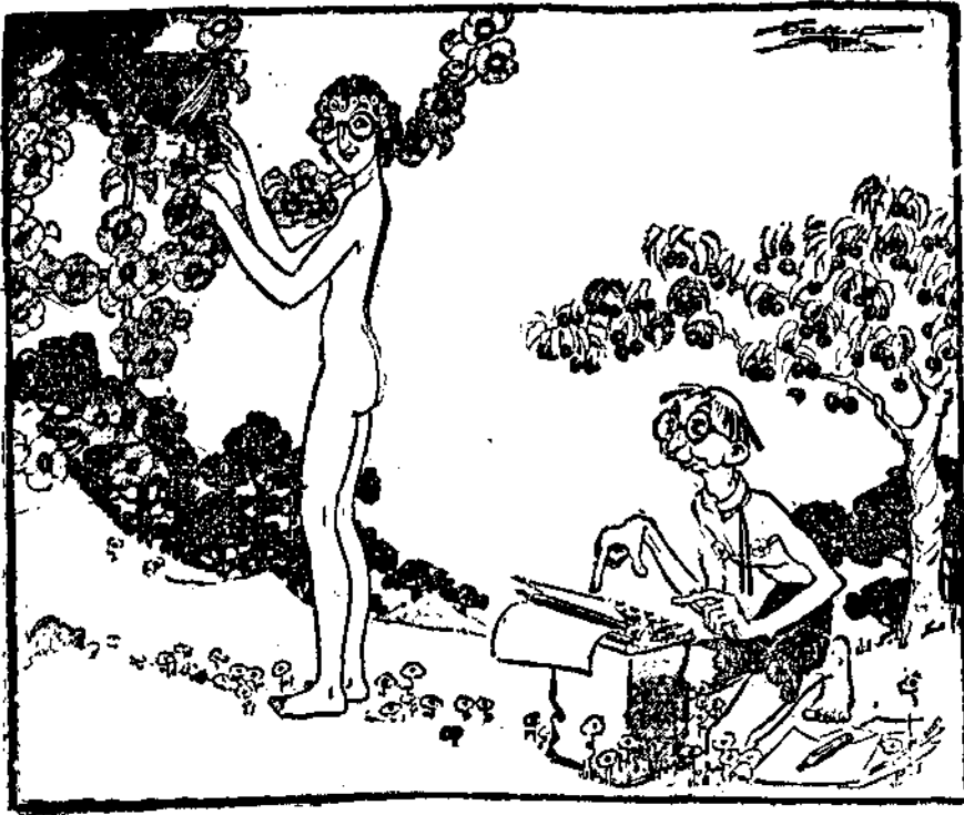
El repórter.—¿Y hace mucho tiempo que es usted deanulista, señorita? —¡Oh, sí! Naol así ya. (De «New-Yorker American».)