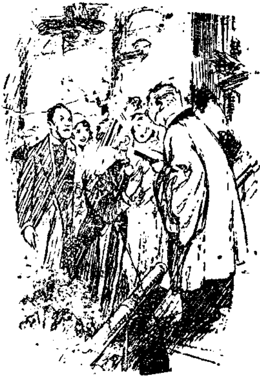
El novio.—Espere un poco. Este anillo me recuerda algo. Algo así como que ya estoy casado. (De «Humorist», Londres.)