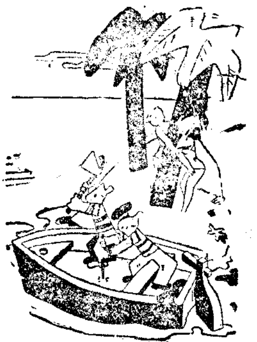
—Pero, ¿qué hacen ustedes? ¿Están locos? —¡Oh, es que queremos ser náufragos también. (De «Sette Bello», Roma.)

ANUNCIOS POR SECCIONES No se admiten anuncios inmorales