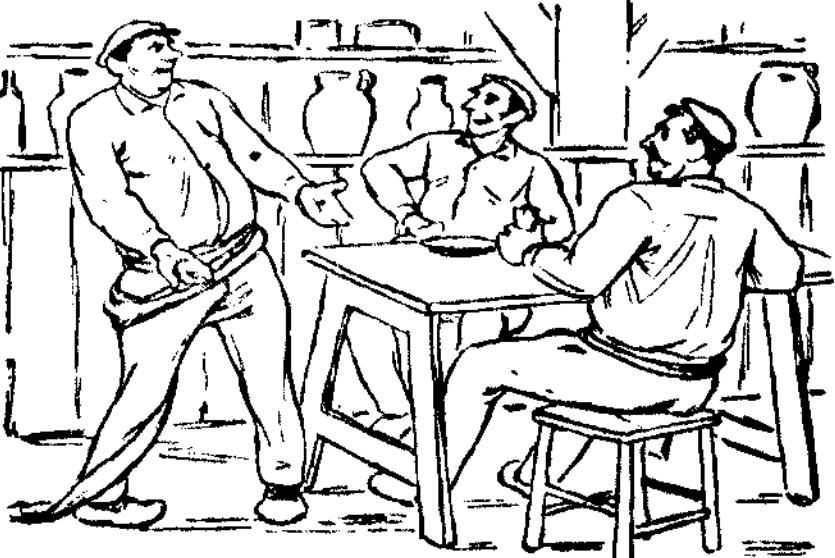
II.—Tú siempre ganorabao y alguna vez si te troneras con algún pirri, en cartzel entrar te harán... ¿Pa qué gritas viva monarquía?