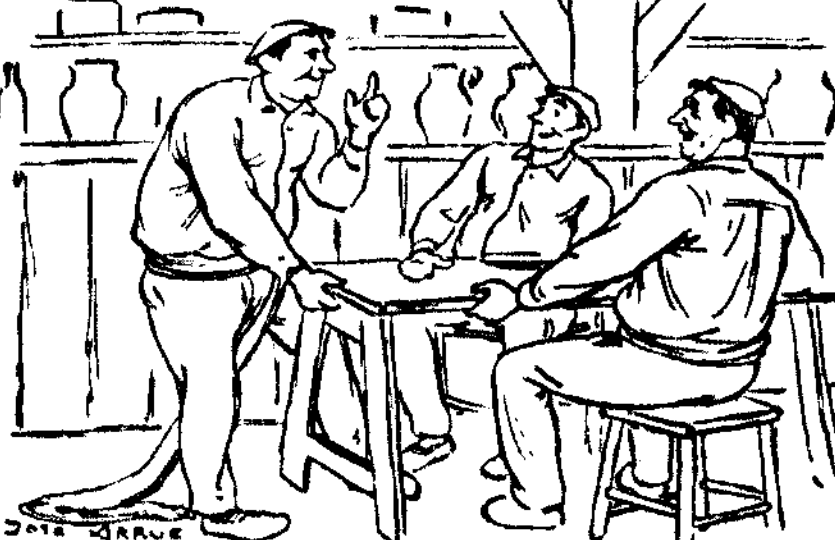
III.—¿Yo? ¡Que le dean a monarquía! Yo "monartía" digo. Este es palabra con raíces vascoastalianas: mona, pues mona, y artía, pues hasta... ¡hasta coger mona...