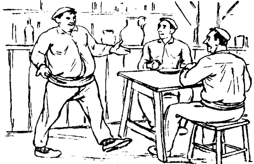
I.—Yo siempre firme, Alponso si le han tirao también... ¡Nada no hay como "monartía"! ¡Viva "monartía"!