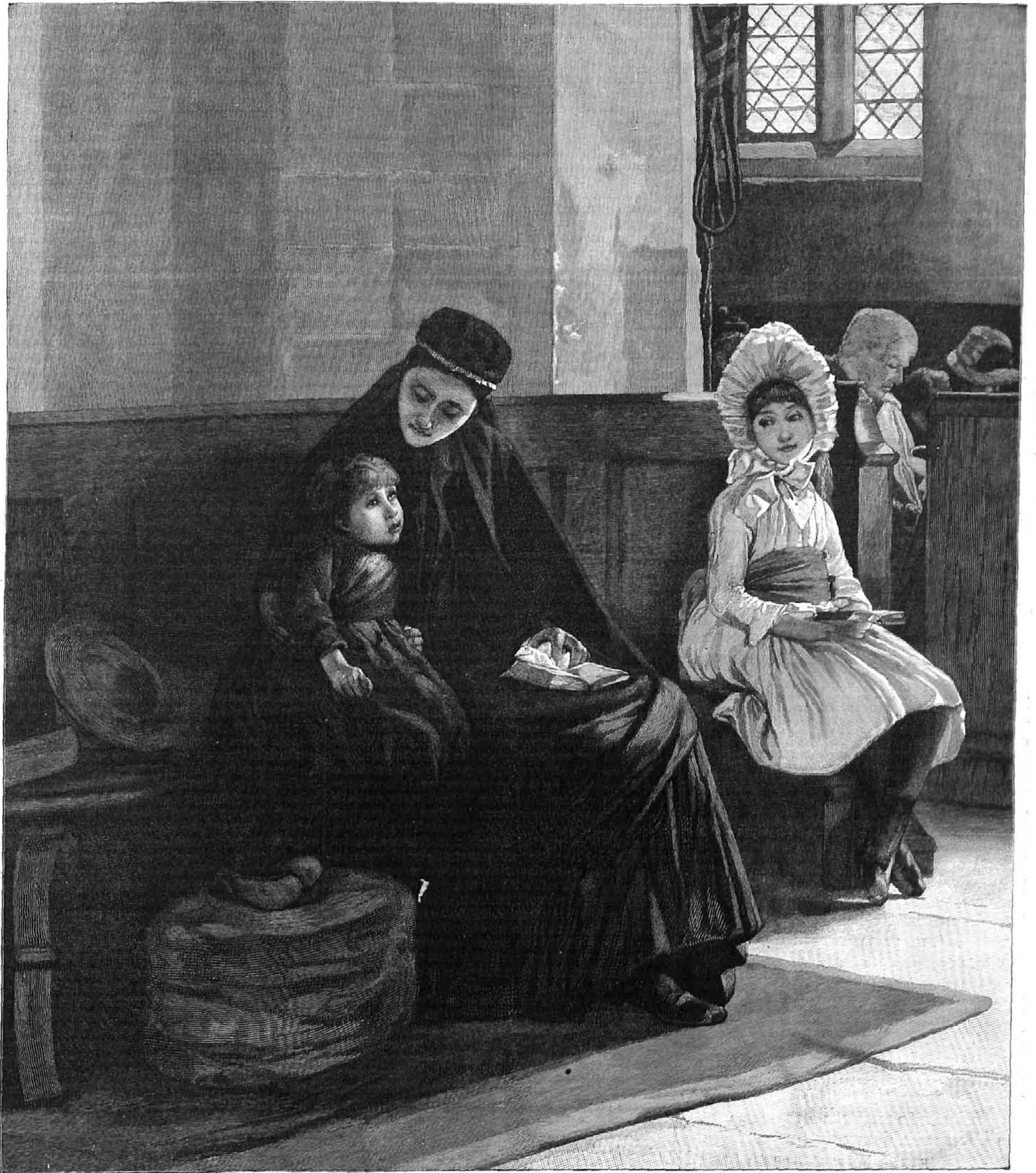
À TÍ SUSPIRAMOS cuadro de M. King