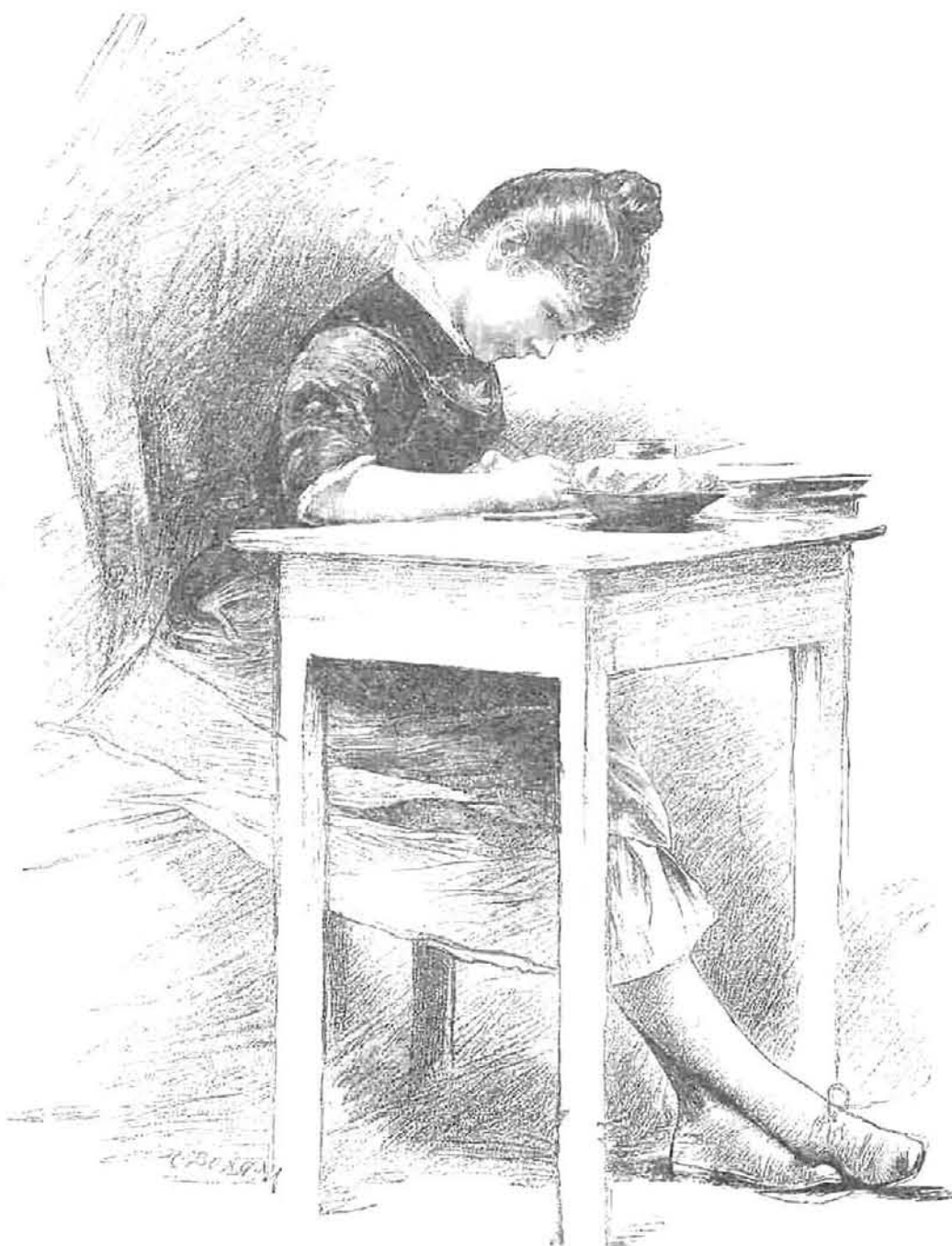
HORA DE ESTUDIO, dibujo de Carlos Froschl, grabado por Bong

Así, pues, mientras alguno acariciaba la halagadora ilusión de entrar en el pueblo luciendo en el ojal la retorcida cola del valiente jabalí, soñaba otro en la curtida piel del ligero corzo que como glorioso recuerdo debía ostentar antes de mucho tendida delante de su lecho, en tanto que un tercero veía en lontananza la coronada cabeza del rendido ciervo, descollando cual preciado trofeo en su cuarto de armas. Más modesto el corredor de liebres, miraba por los aires, volteadas por la tralla de su certero látigo, liebres enormes por docenas, por cientos y por miles; mientras el tirador de conejos se dibujaba en su fantasía un soto donde saltaban á su paso como los átomos del polvo movido por el viento. El cazador de perdices veía en el espacio bandas por su perro levanta-