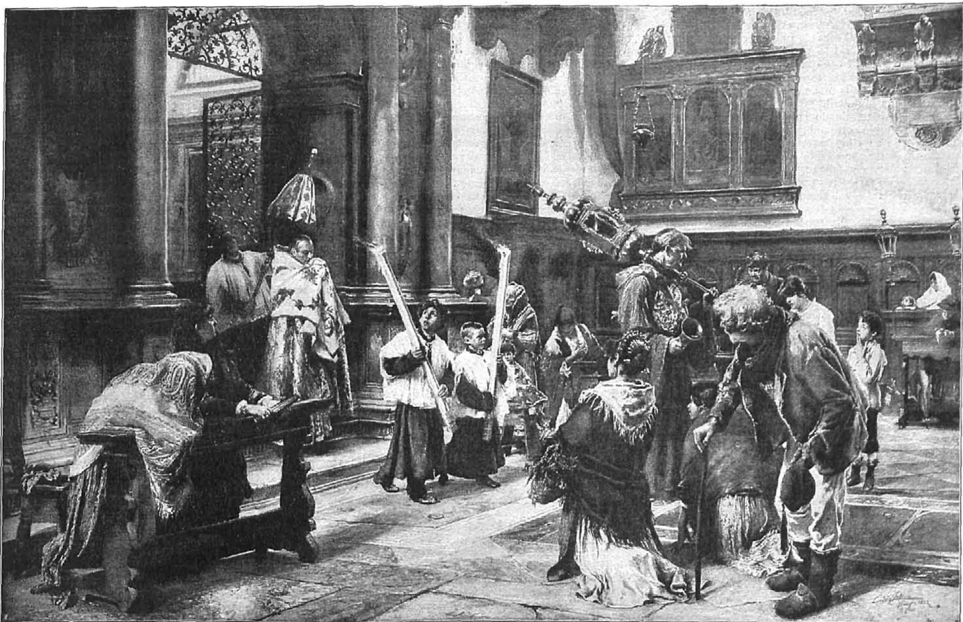
EL VIÁTICO, cuadro de Luis Passini

Preocupábase de tal manera la idea de que el plebeyo