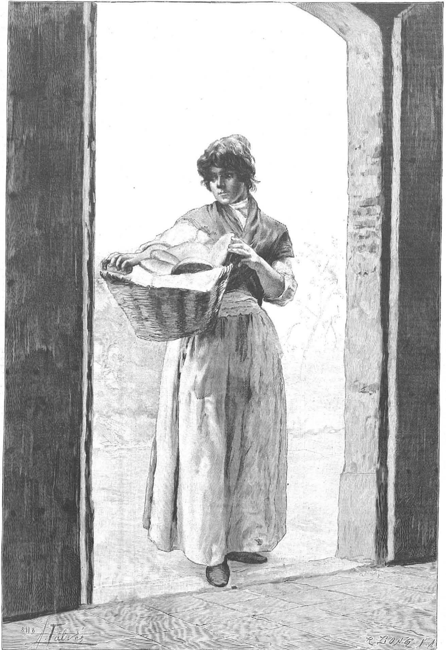
UNA «FORNARINA,» dibujo de A. Fabrès, grabado por R. Bong