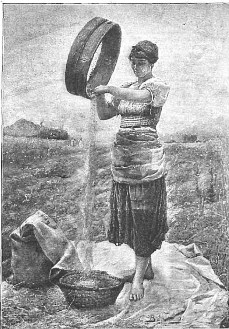
AECHANDO EL TRIGO, cuadro de Odón von Baditz, presentado en la última Exposición de pinturas de Munich

— Los granos de arena son tantos como estrellitas hay en el cielo.