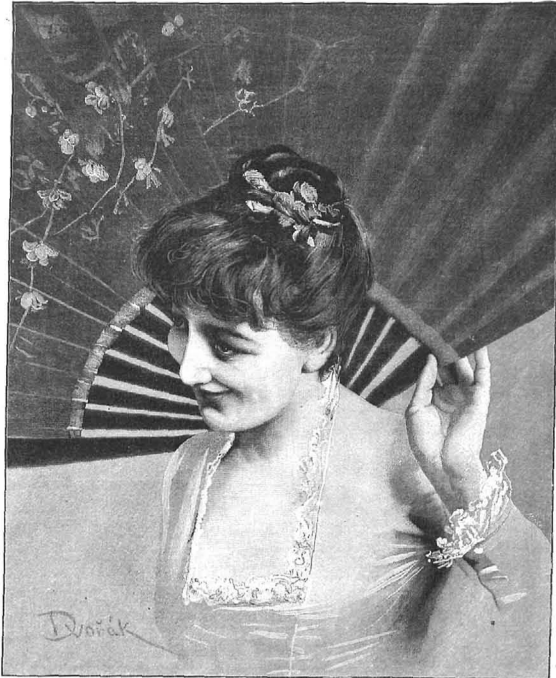
COQUETERÍA, cuadro de Dvorak

Sisenanda llamábase la heredera del trono, y era un