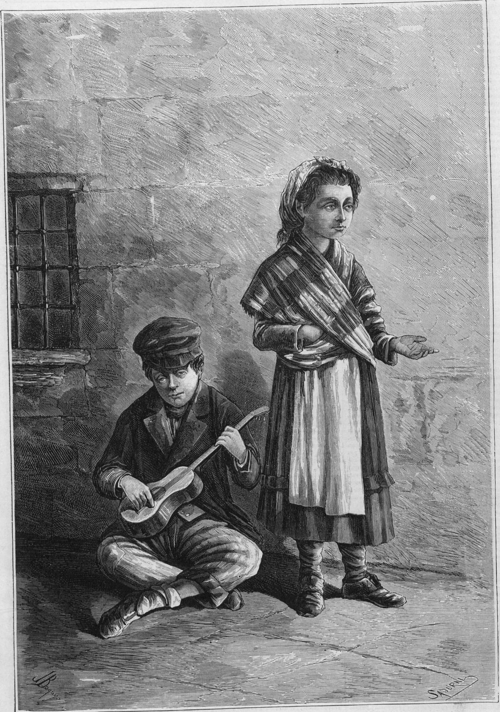
DIBUIX DE BAQUERO