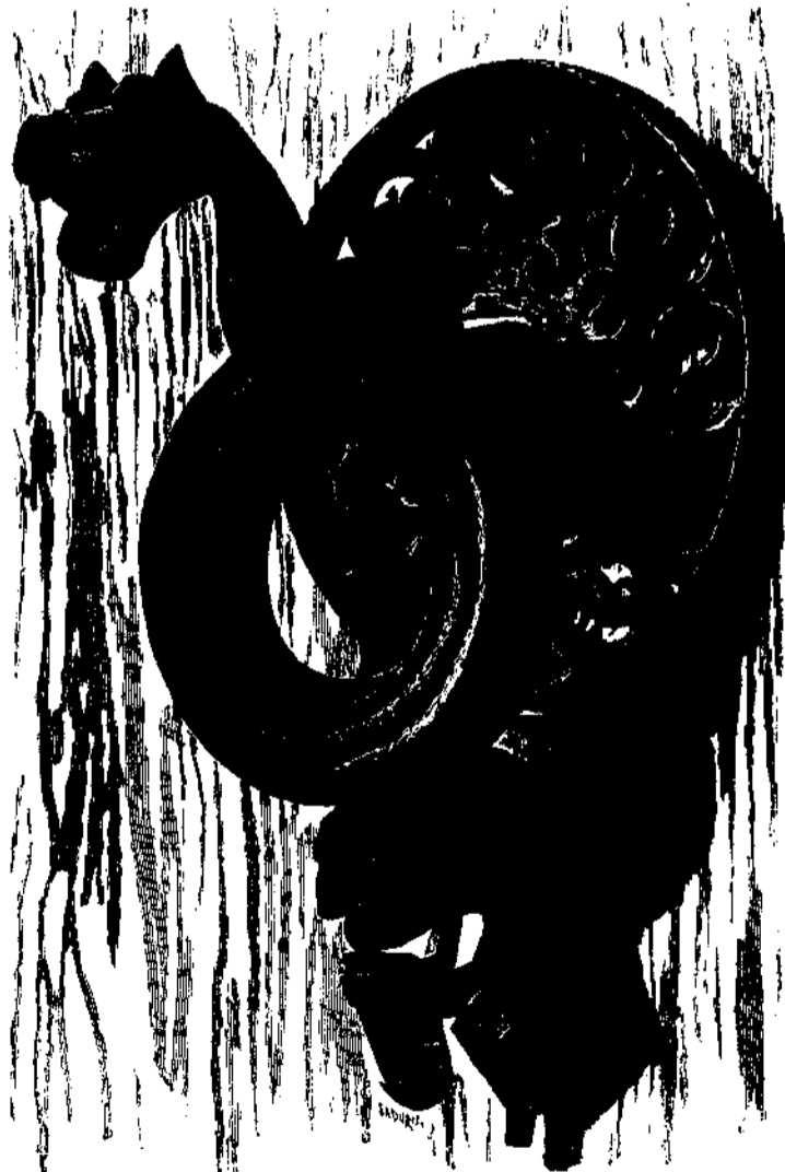
PICAPORTA DE CASA L'ARDIACA DE LA CATEDRAL DE BARCELONA Dibuix de Catalá. Grabat per Sadurní

Aixis com los pagesos, y gent del camp, si 'ls escolteu may vos dirán qu' han obtingut una bona anyada, essent tot lo més regular, pera son modo d'entendre, aquella en que 'l blat no 'ls cap á la sitja, ni 'l vi en lo celler, aixis també los fills de ciutat entonan sas lamentacions per un altre ayre; en efecte arriba l' hivern, y al dir d' ells, sempre l' últim es més extremat que 'l que l' havia precedit, de tal manera que si aixó fos veritat, hauriam de tenir per gran regalo lo poder viurer á Canigó ja que ab lo temps que fa que sentim parlar d' hiverns may vistos en nostra ciutat, ben segur que 'ns fora precis abandonar las escalas de Reamur y centigrada que fins ara nos han servit perfectament pera medir nostra temperatura y acullirnos á la de Farenheit que 's fa indispensables en los països del Nort. Pero també aixis com un rellotje mal més en un moment donat del dia nos senyala l' hora verdadera, aixis també als barcelonins, aquest any los hi ha arribat lo torn de fer ab justicia las consuetudinarias exclamacions de cada entrada d' estació; en efecte l' estiu qu' estém atravessant es dels més rigurosos qu' en Barcelona poden haverse experimentat y al fer tal afirmació no es necessari apoyarla ab aquest luxo de números y estats comparatius qu' ara s' estila; es un fent evident y lo qu' es evident no 's prova.