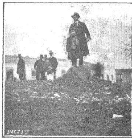
Un monte de... eso, Sr. Alcalde.