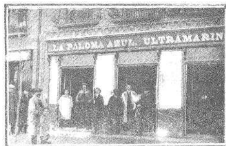
La popularísima casa «La paloma azul».