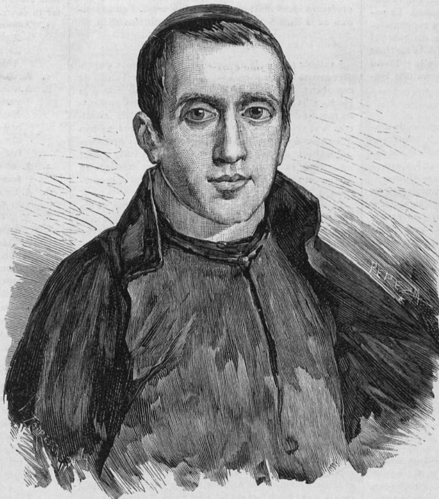
L' INSIGNE FILOSOPH D. JAUME BALMES