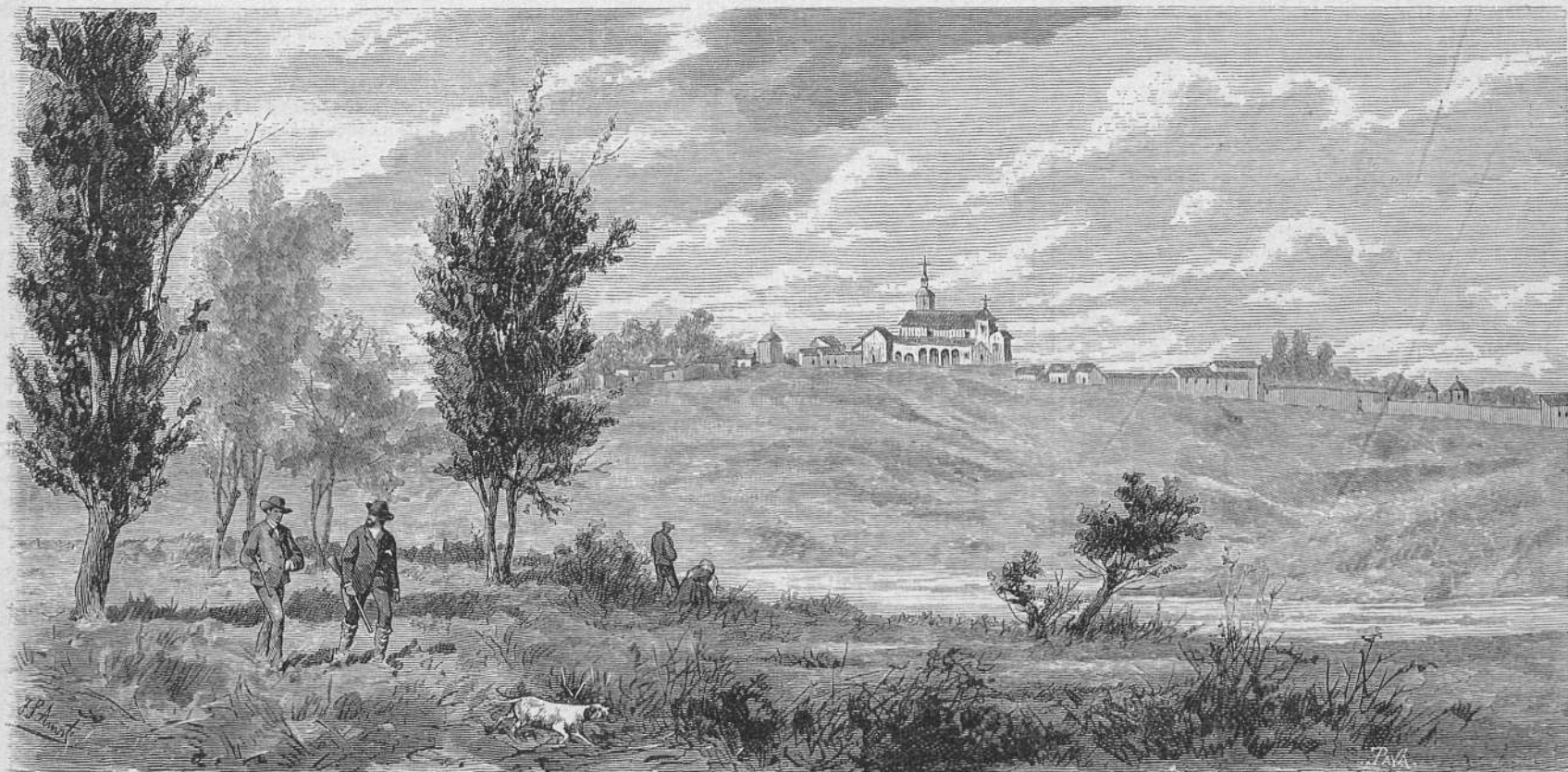
DIBUIX DE AMAT

donar compte, com se merexia, de la sessió celebrada en lo saló de Cent de Casa la Ciutat pera col·locar los retratos d' en Claris y en Balmes, acte que fou sumament concorregut, y ahont l' auditori, despues d' aplaudir justament las memorias biográficas degudas als senyors Collell y Coroleu, admirá los magnífichs retratos al oli dels dos il·lustres patricis, fets ab lo bon acert que acostuman los distingits artistes senyors Borrell (Pere) y Reynés. Las il·luminacions, regatas y castells de fochs, no 'ns oferiren cap novetat, porque, sense tenir res de censurable, tampoch nos mostraren cap innovació artística, ni 's presentaren ab altre forma que la rigorosament rutinaria. Lo tornetx á usansa de l' Etat Mitxana , que