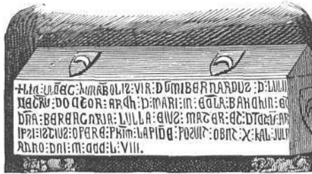
DIBUIX DE TÁMARO