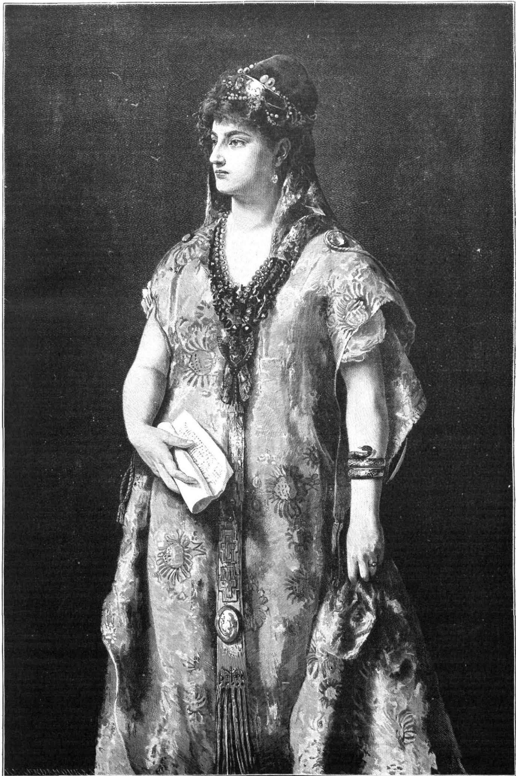
ESTER, copia de un cuadro de Biermann