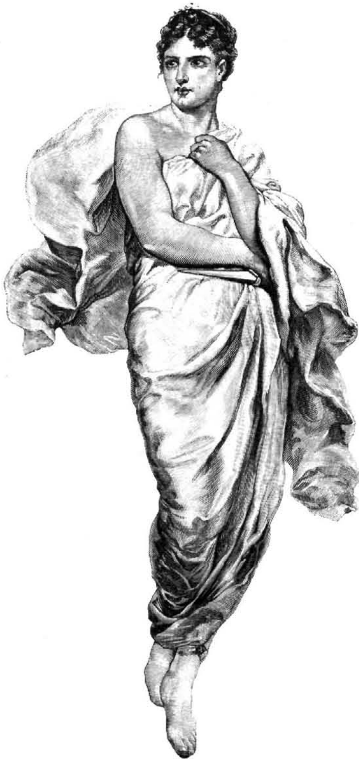
LA TRAGEDIA, pintura decorativa de F. Sans (grabado por Saturni)

En los círculos geográficos y científicos de Londres han excitado vivísimo interés los relatos del capitán Burton y del comandante Cameron á su regreso de la Costa de Oro en Africa. El primero dice que al desembarcar encontró mujeres lavando arenas auríferas y ganando un