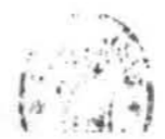
UN PASEO POR EL LAGO DEL PARQUE DE WINDSOR (POR W. H. OVEREND)