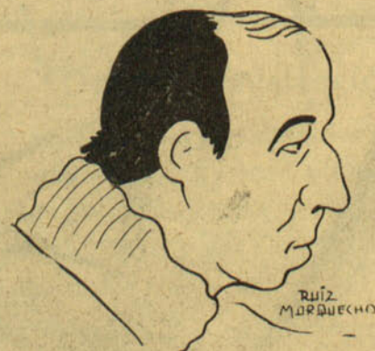
El Presidente del C. P. de Asistencia Social