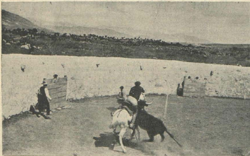
Becerro de tiesta para las vacas