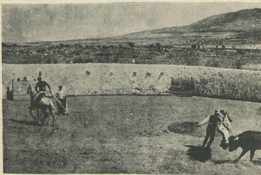
Un quite de Salvador