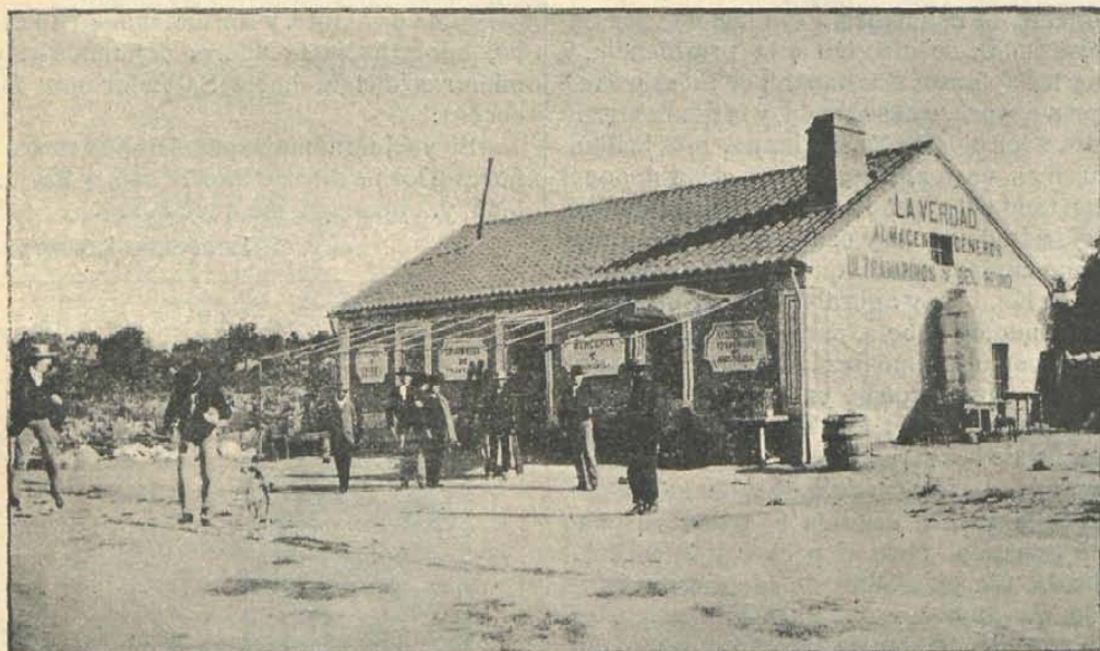
Casa de Frascuelo en Torrelodones