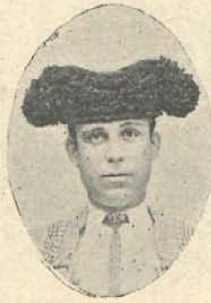
Rafael Guerra (Guerrita) 27 Setiembre 1887 Capuchinos, 10, Córdoba.