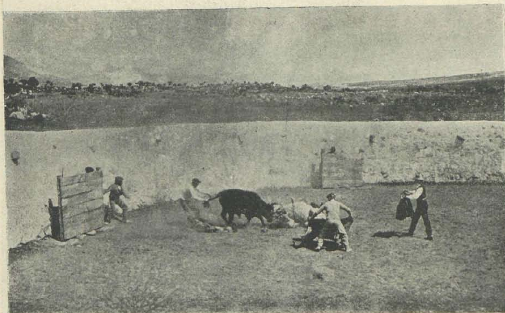
Caída del tentador