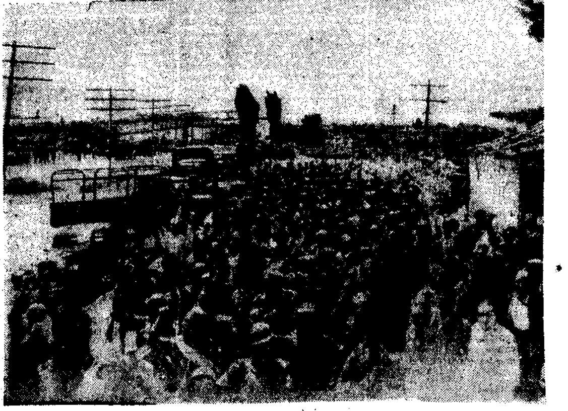
Soldados y milicianos dirigiéndose al frente

La vigilancia de la Armada sigue siendo minuciosa en el estrecho de Gibraltar. Los barcos al servicio del régimen, que son todos los que integran la Marina de guerra, bombardean las plazas de Melilla y Ceuta e impiden el tráfico de tropas rebeldes, que ya ni siquiera intentan embarcar con rumbo a España. Tampoco les es posible a los sublevados de la zona de Marruecos el auxilio, por aire, a los que en la Península secundaron el movimiento. En Madrid, la vida ciudadana se desarrolla de una manera completamente normal. Los vehículos del servicio público circulan con regularidad y los establecimientos siguen realizando sus transacciones como de ordinario. Se trabaja en todos los talleres, fábricas, oficinas y departamentos oficiales. La única novedad radica en la agitación que en Centros políticos y sindicales existe por consecuencia de la recluta de voluntarios para engrasar las columnas gubernamentales y en el entusiasmo con que en todas partes se acogen las victorias de las tropas y fuerzas leales de mar y aire. En Cataluña igualmente se ha restablecido la normalidad. El Gobierno de la Generalidad adopta disposiciones encaminadas a cooperar con el Poder central al exterminio de la insurrección. En la región levantina la Junta delegada del Gobierno, que di-