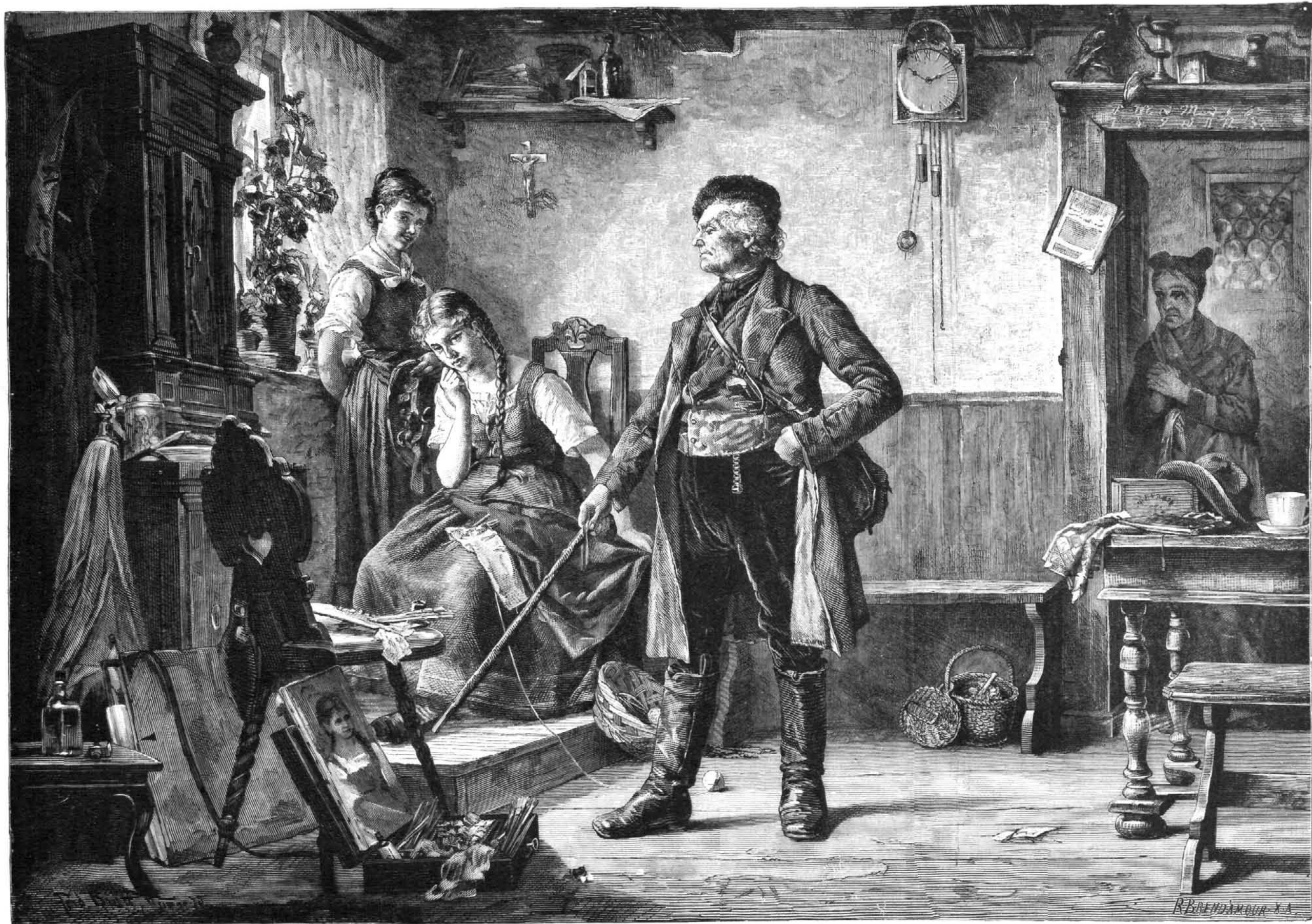
EL RETRATO DELATOR, cuadro de F. Brutt