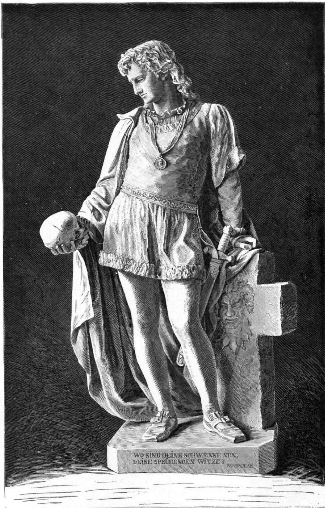
HAMLET estatua por A. Weizenberg

En general, un cambio de 10° de latitud no produce más que un descenso de 1°; de modo que, después de haber recorrido más de 5,000 kilómetros en el Norte, esta portentosa corriente aún conserva en el invierno el calor del verano. Así es que después de alcanzar el paralelo 40, se la ve penetrar en las aguas frías de esta región, en una superficie de varios miles de leguas cuadradas, y extender de este modo sobre el Océano un verdadero manto de agua caliente. Su marcha es entonces más lenta, pero también es más considerable la cantidad de