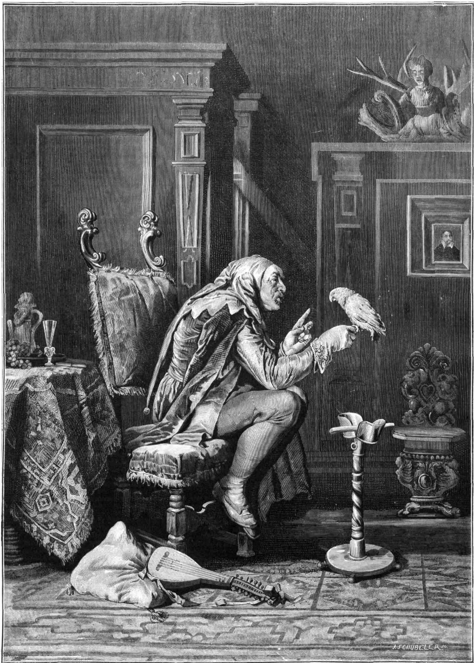
EL BUFON Y LA COTORRA