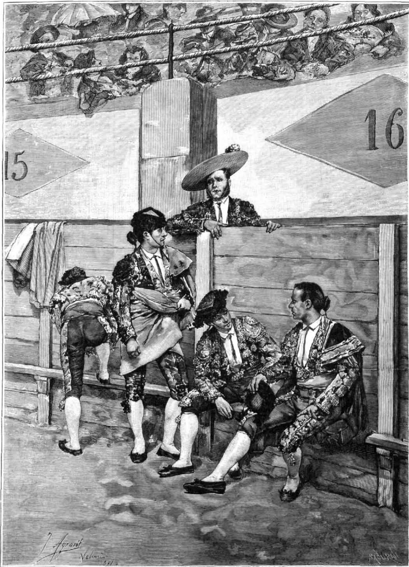
EN LA PLAZA, acuarela por J. Agrasot

REGALO A LOS SEÑORES SUSCRITORES DE LA BIBLIOTECA UNIVERSAL ILUSTRADA