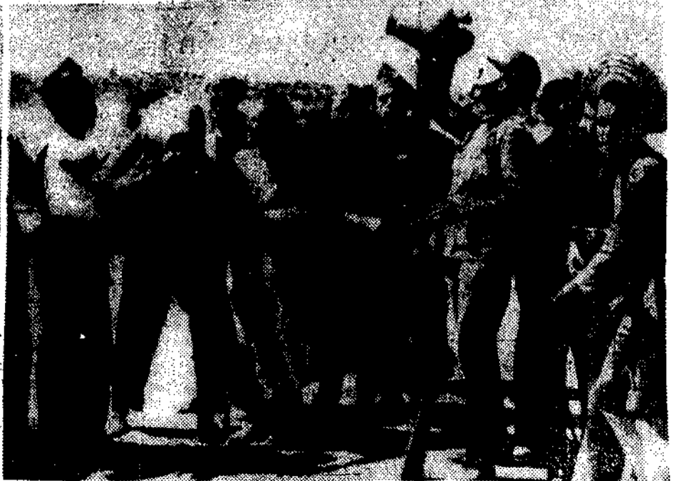
LA TOMA DE TOLEDO POR LAS FUERZAS LEALES.—1. La columna del general Riquelme avanza hacia Zocodover.—2. La pieza de artillería que con sus certeros disparos logró incendiar parte del Alcázar, principal reducho de los rebeldes.—3. Momento de precipitarse las milicias toledanas al asalto de la población en las últimas horas de la tarde, en medio del incandescente fuego de los sediciosos.—4. Soldados y milicianos se juntan para apagar su sed, servidos por bellas toledanas, bajo el inclemente fuego del mediodía, durante el cual la lucha apenas si les dió un minuto para comer.